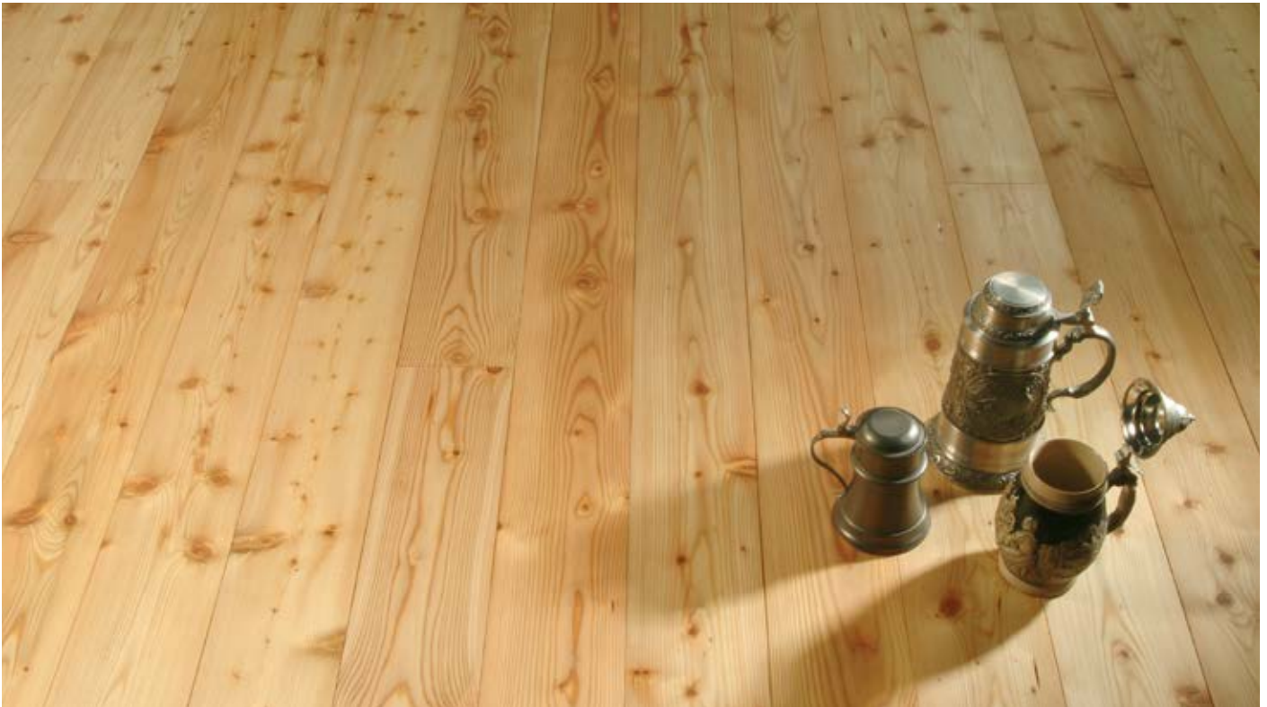
Oberfläche Naturöl / Surface natural oil / Superficie olio naturale