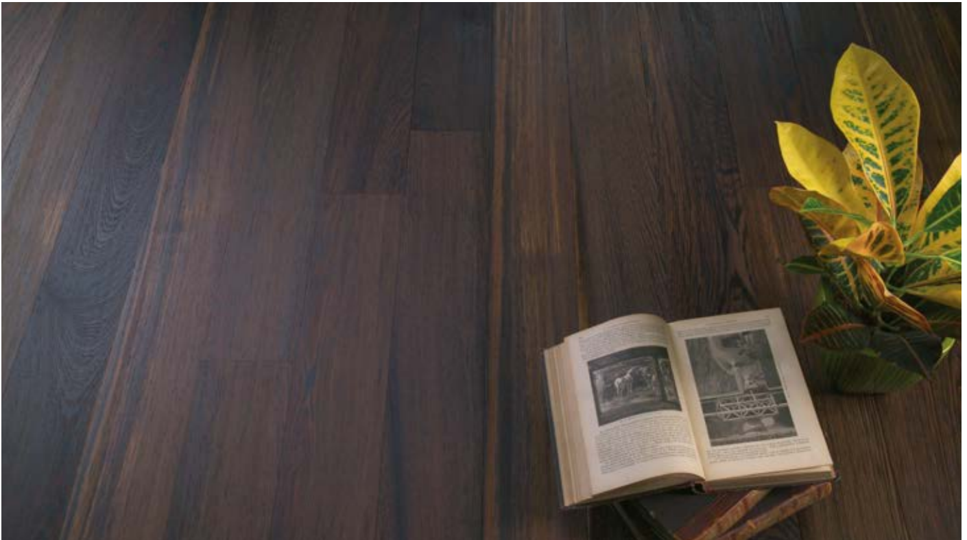
Oberfläche Naturöl / Surface natural oil / Superficie olio naturale