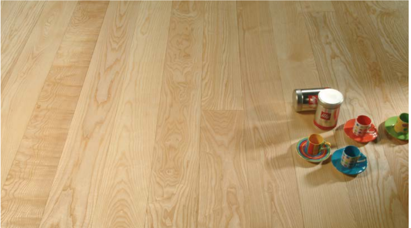
Oberfläche Naturöl / Surface natural oil / Superficie olio naturale