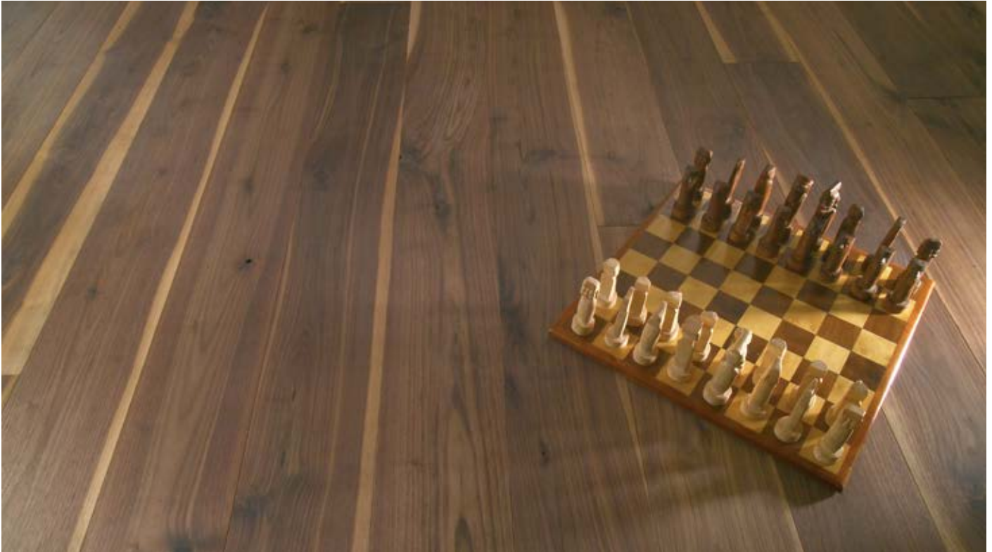
Oberfläche Naturöl / Surface natural oil / Superficie olio naturale