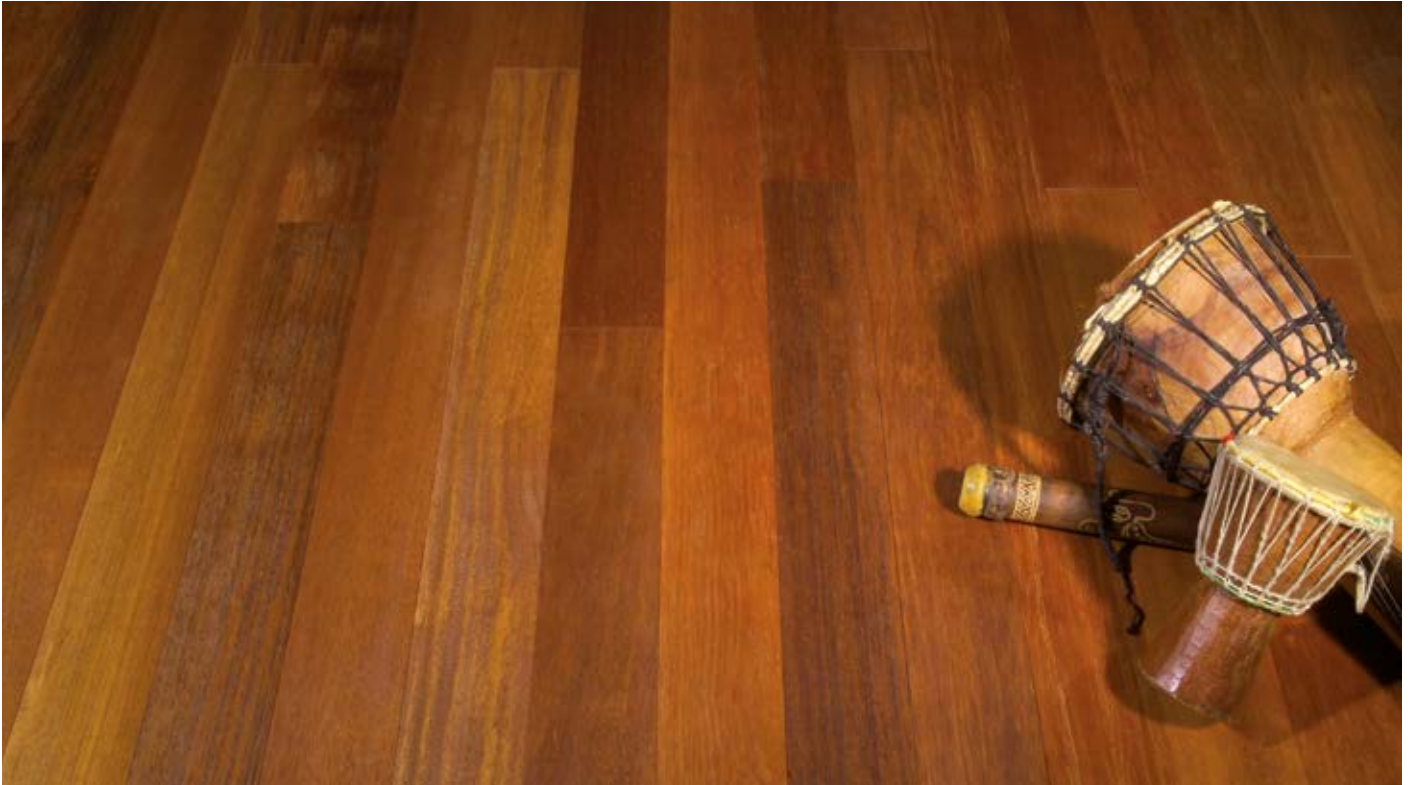
Oberfläche Naturöl / Surface natural oil / Superficie olio naturale