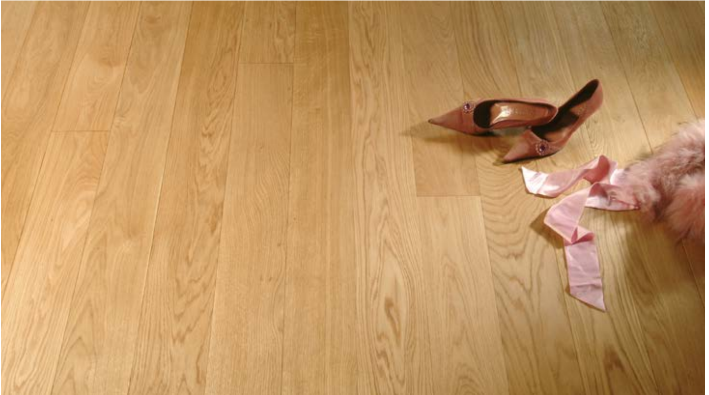
Oberfläche Naturöl / Surface natural oil / Superficie olio naturale