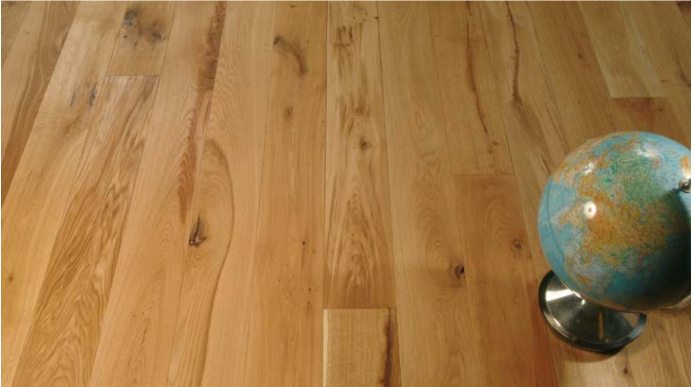
Oberfläche Naturöl / Surface natural oil / Superficie olio naturale