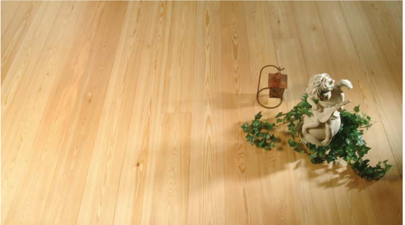
Oberfläche Naturöl / Surface natural oil / Superficie olio naturale