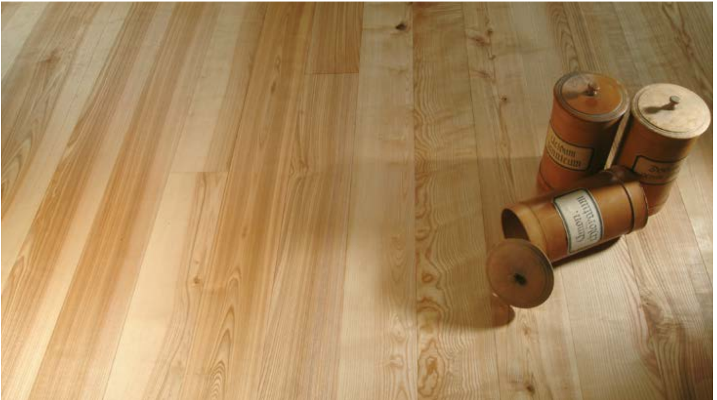
Oberfläche Naturöl / Surface natural oil / Superficie olio naturale