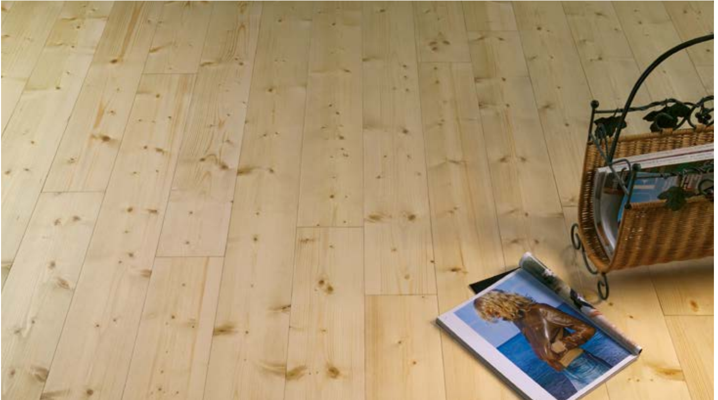
Oberfläche Naturöl / Surface natural oil / Superficie olio naturale