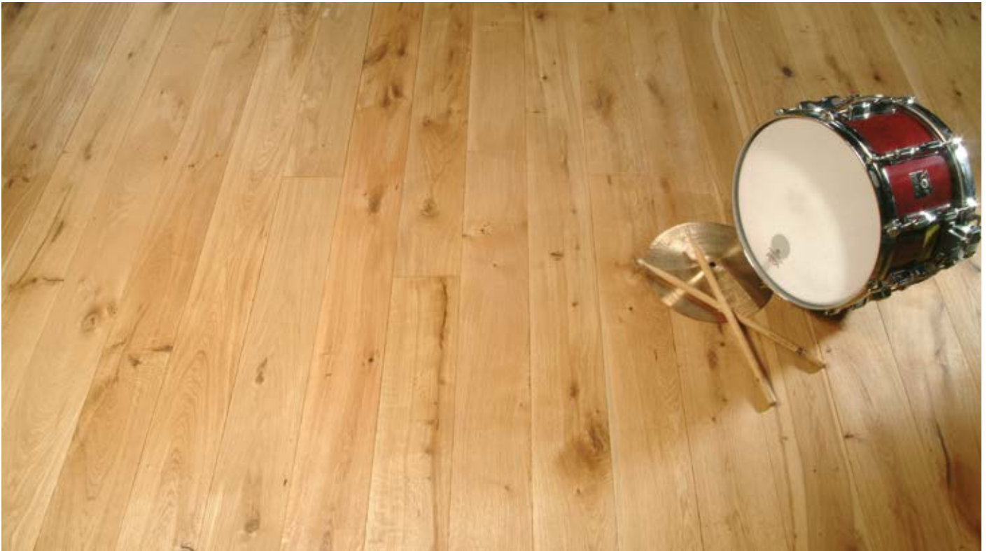
Oberfläche Naturöl / Surface natural oil / Superficie olio naturale