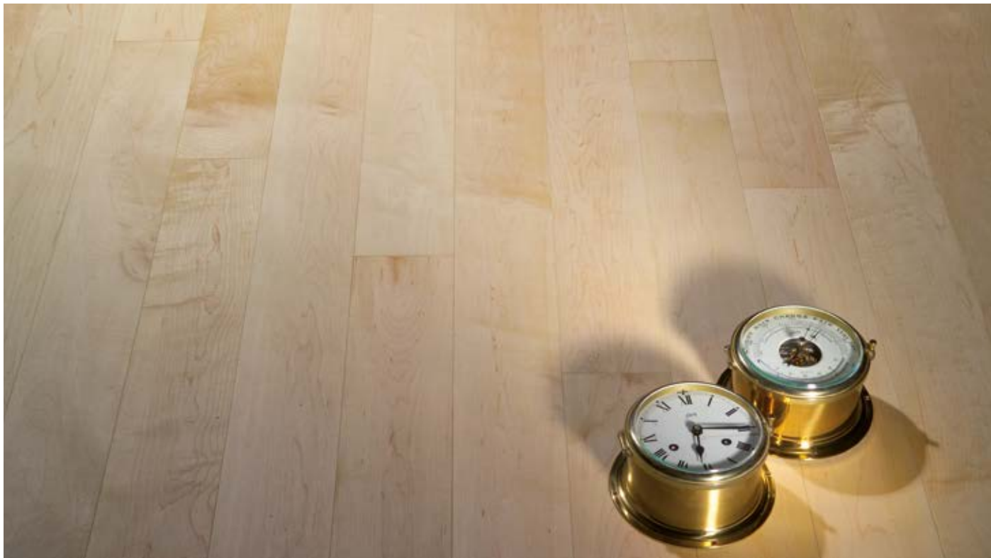
Oberfläche Naturöl / Surface natural oil / Superficie olio naturale