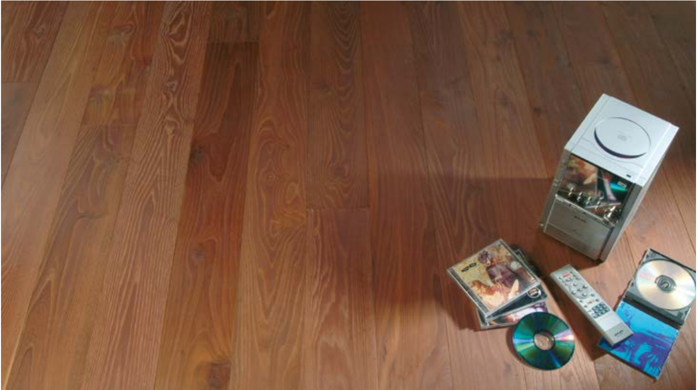
Oberfläche Naturöl / Surface natural oil / Superficie olio naturale