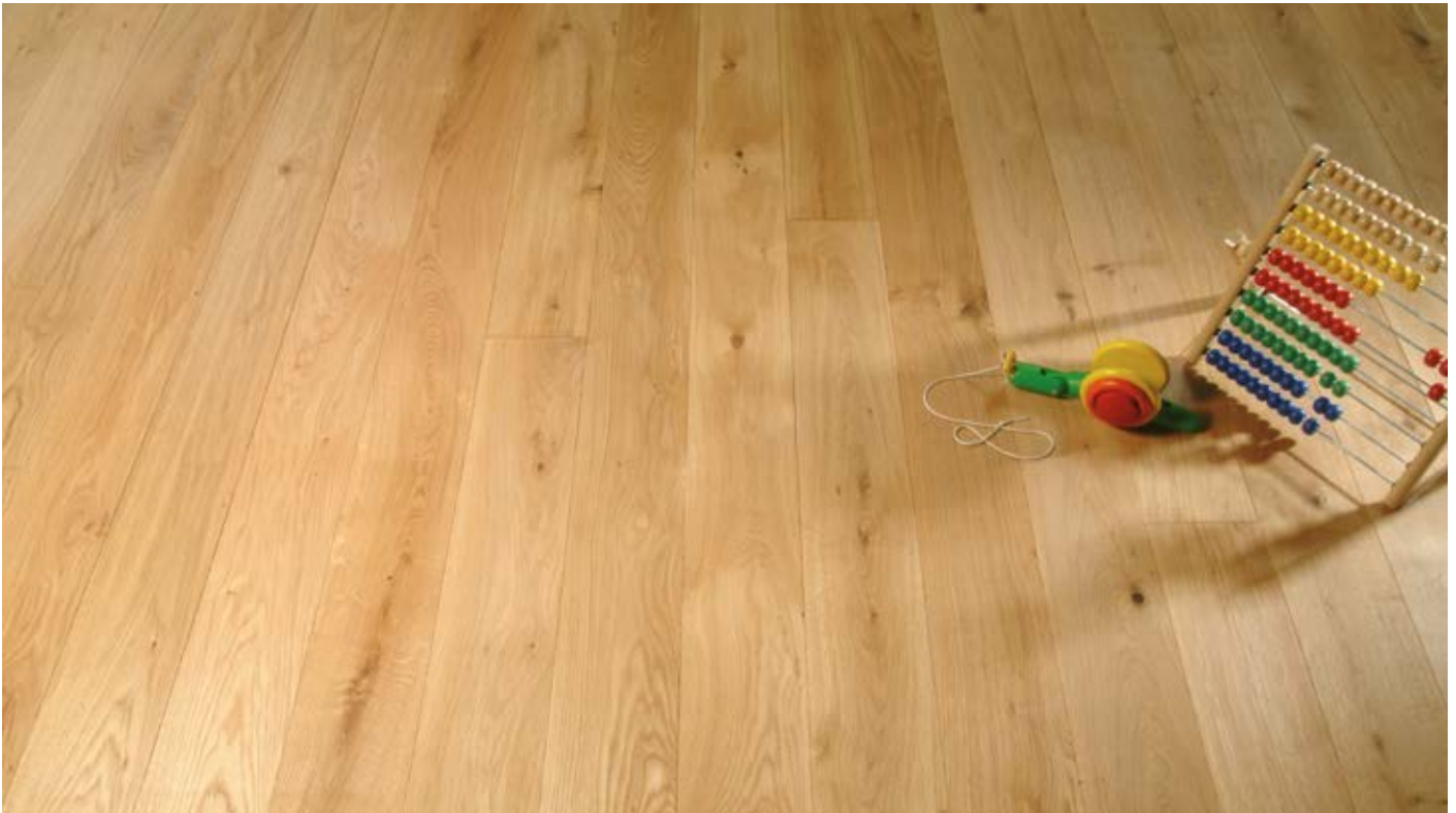
Oberfläche Naturöl / Surface natural oil / Superficie olio naturale