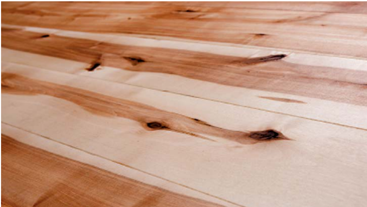
Oberfläche Naturöl / Surface natural oil / Superficie olio naturale