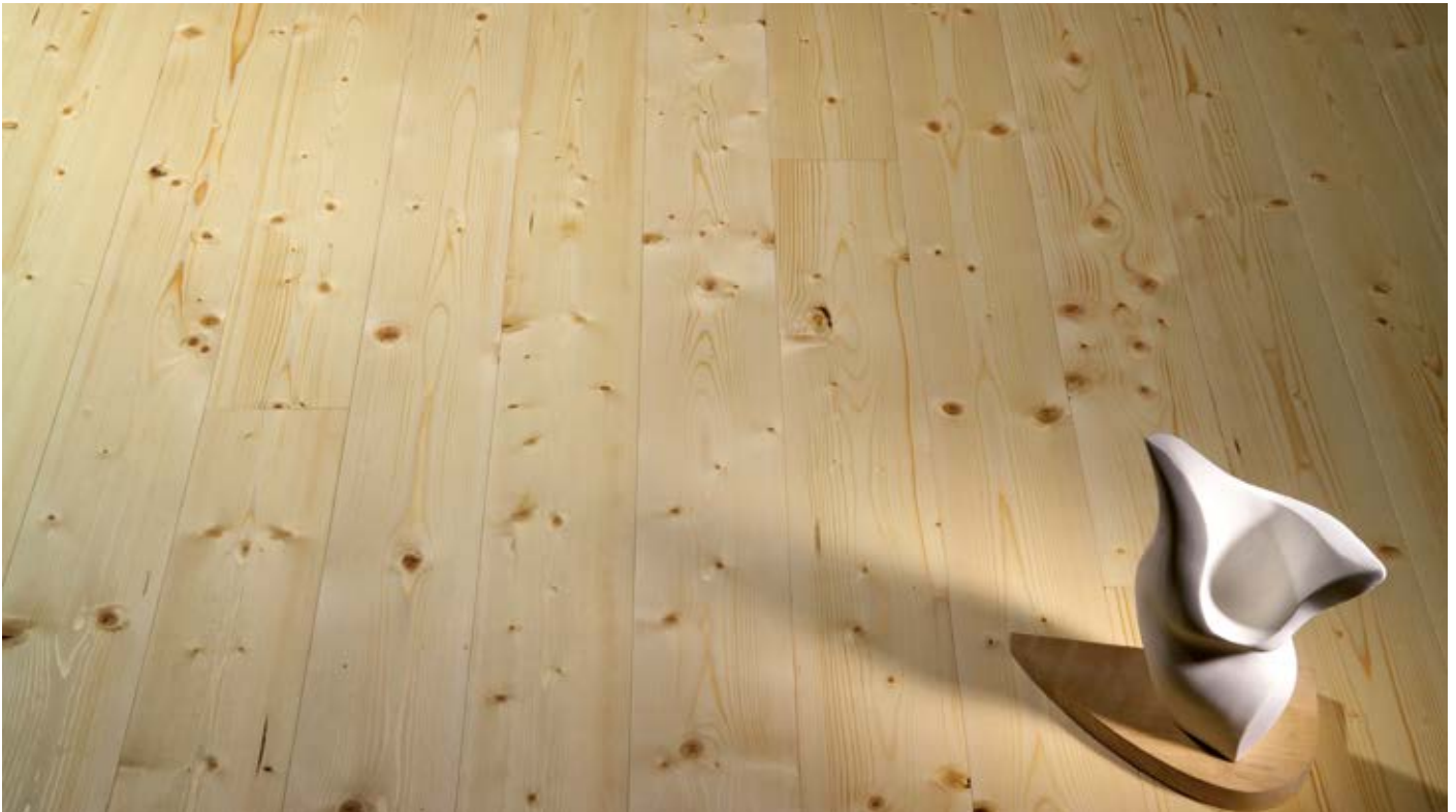
Oberfläche Naturöl / Surface natural oil / Superficie olio naturale