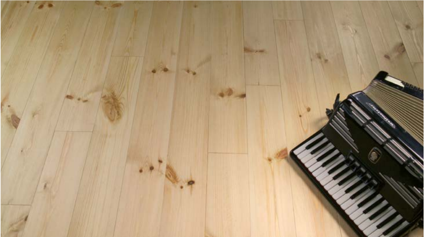
Oberfläche Naturöl / Surface natural oil / Superficie olio naturale