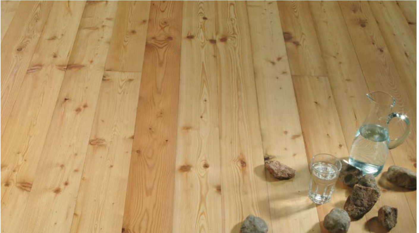
Oberfläche Naturöl / Surface natural oil / Superficie olio naturale