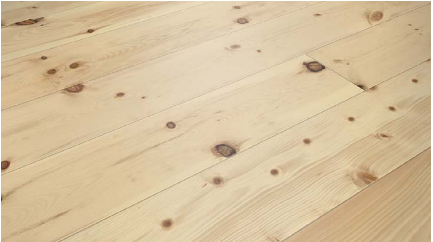
Oberfläche Naturöl / Surface natural oil / Superficie olio naturale