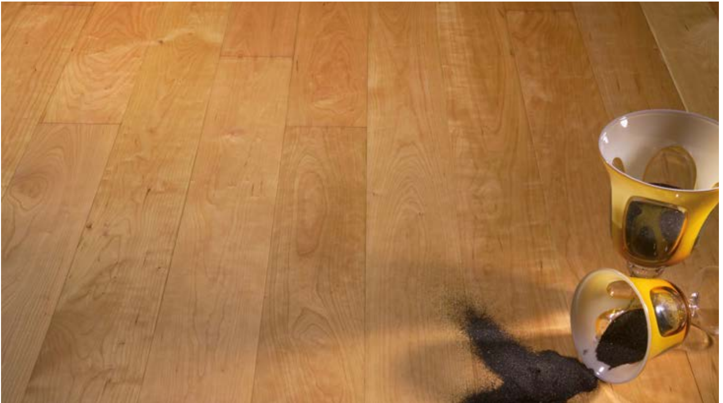
Oberfläche Naturöl / Surface natural oil / Superficie olio naturale