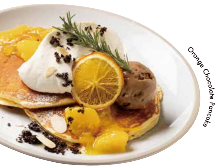
Orange Chocolate Pancake