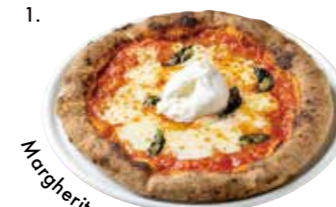
Margherita with Burrata Cheese