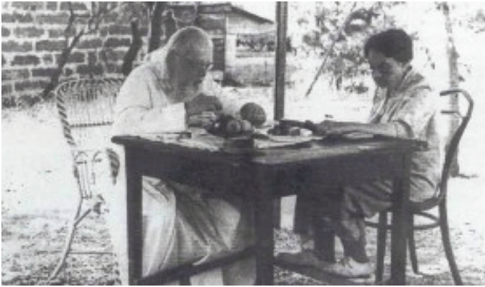
Ὁ Ἅγιος ἀφηγούμενος τὴ ζωὴ του στὴ γραμματέα του