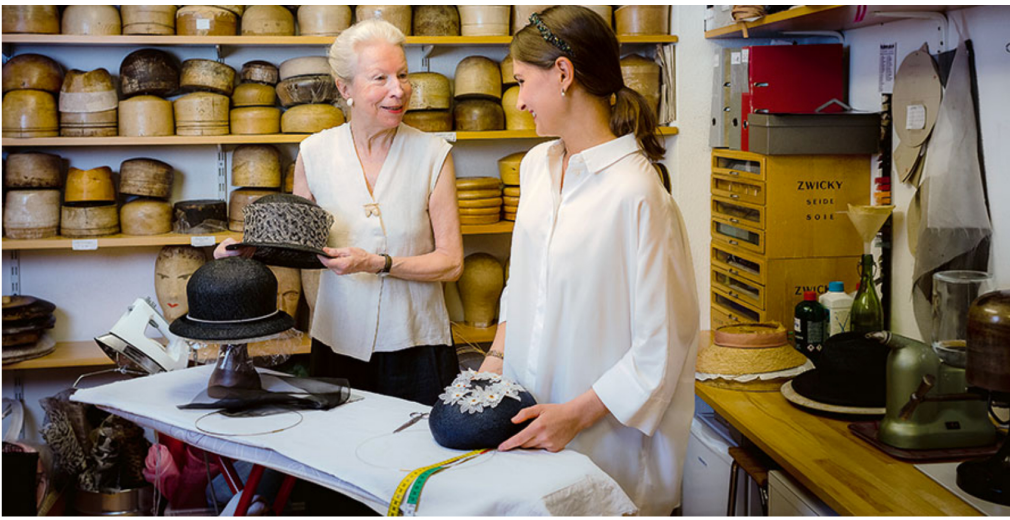
Hölzerne Vielfalt. Die Formen im Hintergrund sind unverzichtbar, wenn die Modistinnen mit geflochtenen Rohlingen arbeiten.