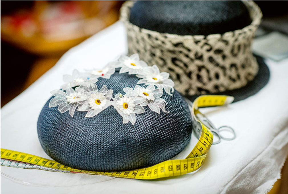
Ein zarter Blütenreigen verzaubert die schlichte dunkelblaue Kreation nach Mass.