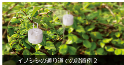
イノシシの通り道での設置例 2