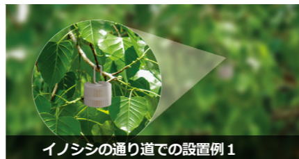
イノシシの通り道での設置例 1