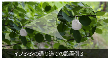
イノシシの通り道での設置例 3