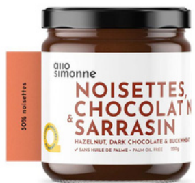
NOISETTES, CHOCOLAT NOIR & SARRASIN