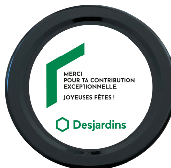
Exemple OPTION 1.A

OPTION 1.B : personnalisation du devant de l'étiquette du pot avec la couleur et le texte de votre choix + ajout de votre logo.