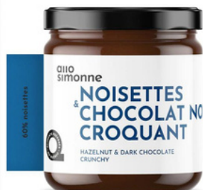
NOISETTES & CHOCOLAT NOIR CROQUANT