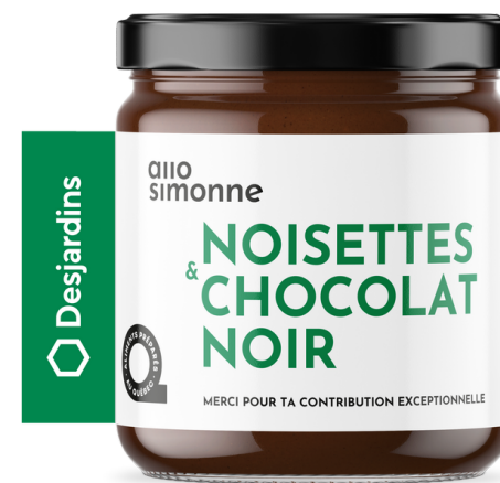
Exemple OPTION 1.B