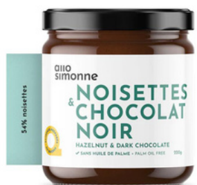
NOISETTES & CHOCOLAT NOIR

Choisissez le pot de 220g de votre choix parmi cette sélection de 6 tartinades savoureuses.