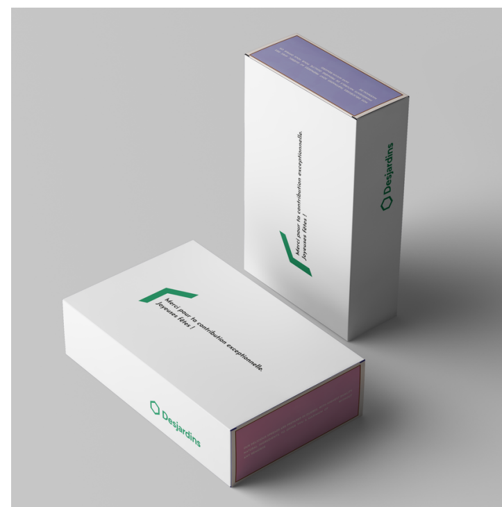
Exemple OPTION 3.A

OPTION 3.A : ajout d'une manchette sur papier carton glacé par-dessus la boîte avec votre logo et message.