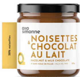
NOISETTES & CHOCOLAT LAIT