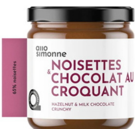
NOISETTES & CHOCOLAT AU LAIT CROQUANT