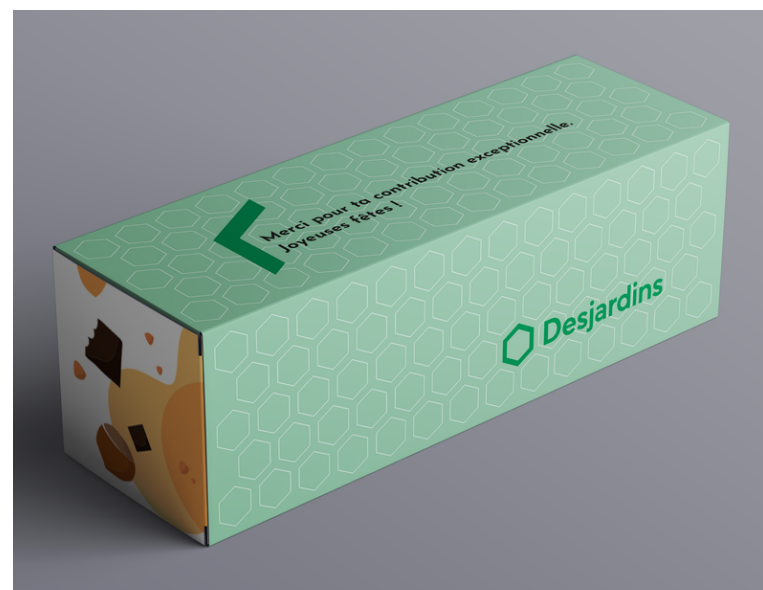
Exemple OPTION 2.A

OPTION 2.A : ajout d'une manchette sur papier carton glacé par-dessus la boîte avec votre logo et message.