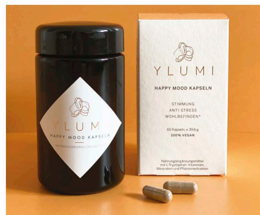
Happy Mood Kapseln 60 Kapseln für 30 Anwendungen

nin im Körper darstellt. Und auch die weiteren Inhaltsstoffe der HAPPY MOOD KAPSELN können sich sehen lassen: L-Tryptophan, Rosenwurz, Ashwagandha, Folsäure, Biotin, Magnesium und ein Komplex aus natürlichen B-Vitaminen liefern die ideale Wirkstoffkombination, um den Körper bei der körpereigenen Bildung von Serotonin zu unterstützen, den Organismus effektiv vor oxidativem Stress zu schützen und Nerven und Psyche zu stärken.