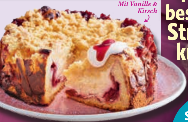
Mit Vanille & Kirsch

Supercremig, extrafruchtig 4 ganz besondere Streusel- kuchen s. 46