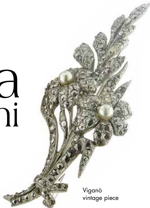
Viganò vintage piece