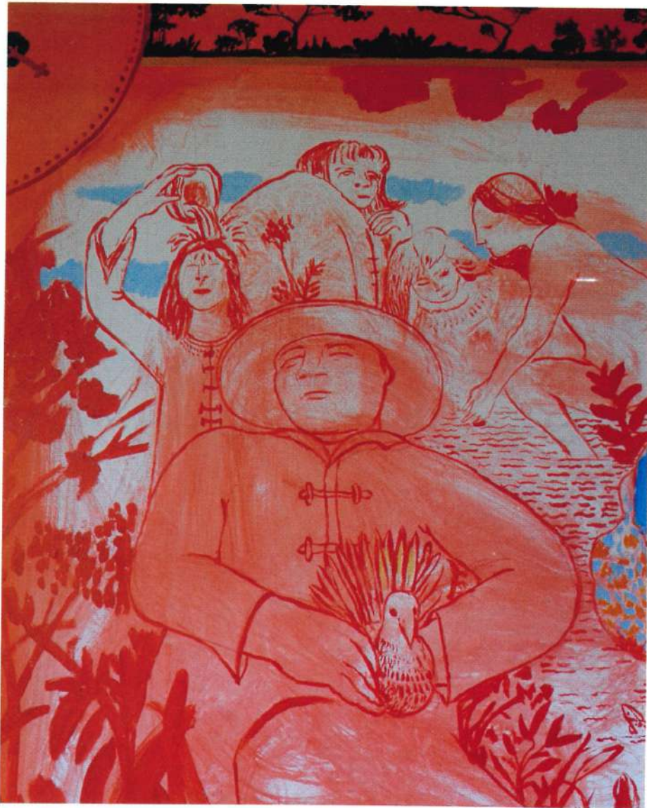
Detalle de Domingo de fiesta China en Albrook, 2015