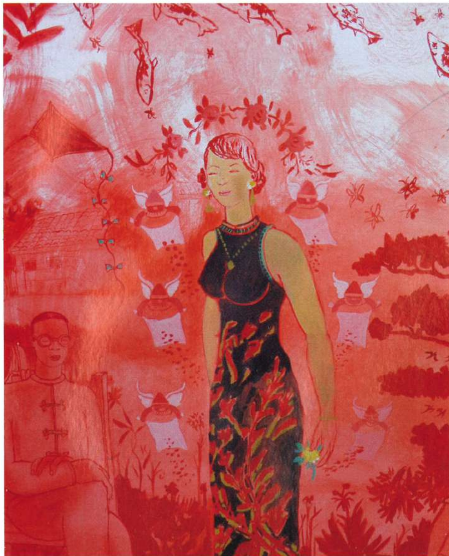
Detalle de Domingo de fiesta China en Albrook, 2015

Sus obras han recorrido el mundo americano y buena parte de Europa, participando en las Bienales de Venecia de 1986, 1997 y 2001, y en de La Habana en 1989 y 1991. Reconocido por la crítica florentina y europea, realiza murales públicos de grandes dimensiones en varias ciudades italianas como Florencia y Pisa. En Panamá también realiza grandes trabajos murales como el del Centro Regional Universitario de Veraguas, o el domo del Hospital Santo Tomás, entre otros.