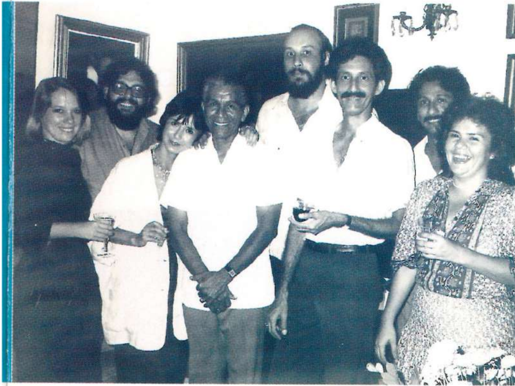
Amigos artistas y del ámbito cultural en casa de los Sinclair.

A principios de los 80, Sinclair realiza la serie "Movimiento de un río", composiciones cargadas de textura y movimiento donde, nuevamente, la mancha se vuelve protagonista. Sin embargo, a mediados de la década adoptará la figura humana como tema principal de su obra.