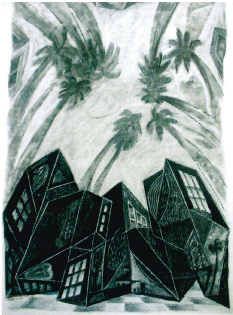
Dibujo, serie "Paisajes Urbanos", carboncillo y sanguina sobre papel canson

Fernando Toledo nació en Cuenca, Ecuador en 1962 y reside en Panamá desde 1991; tiene título de Profesor de Arte especializado en Pintura de la Escuela de Bellas Artes de Cuenca, Ecuador. Ha expuesto de manera individual y colectiva desde 1984 en Latinoamérica, Estados Unidos y Europa; obtuvo el Segundo Premio Nacional de Acuarela, Quito-Ecuador 1988; y ganó el Premio Nacional de Pintura INAC 1993. En las Bienales de Arte de Panamá fue ganador del Primer Premio en 1994 y 1998 y del Segundo Premio en 1996. En el 2005 obtiene el Primer Premio en el Salón Nacional de Pintura Roberto Lewis, de Panamá. Toledo fue seleccionado por el Vermont Studio Center de Estados Unidos, como artista residente durante Enero - Febrero de 2003.