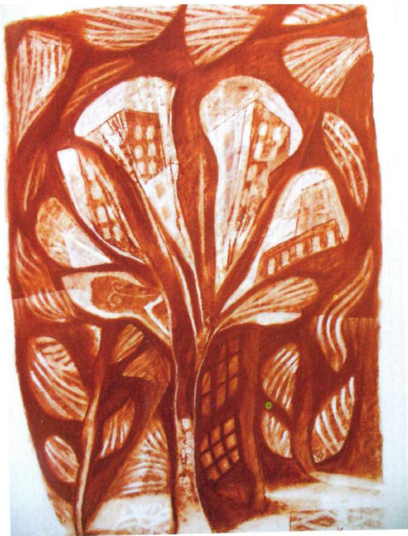
Dibujo, serie "Paisajes Urbanos", carboncillo y sanguina sobre papel canson