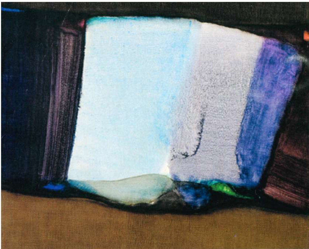
Alfredo Sinclair, "Movimiento de un río", 1980