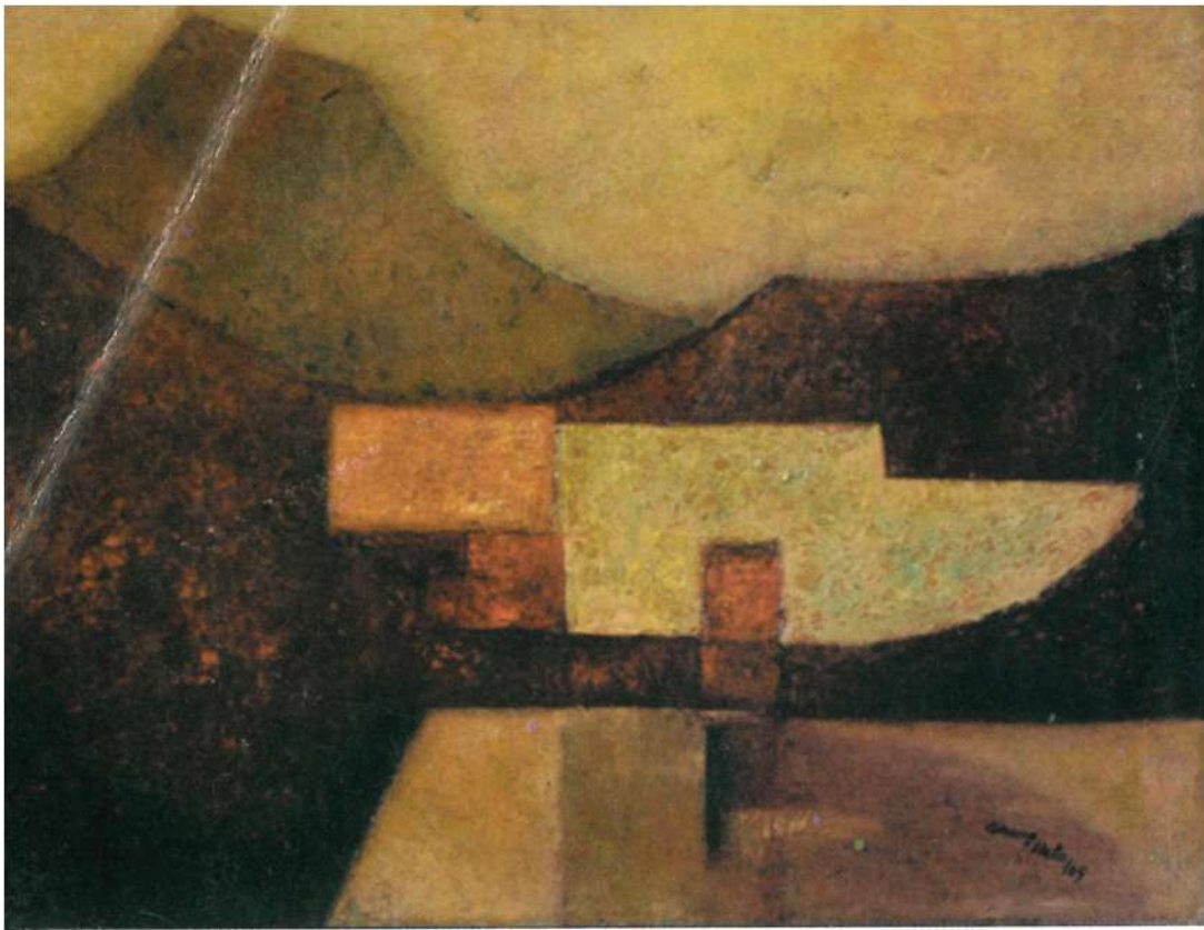
Manuel Chong Neto, "Paisaje en rojo", 1965