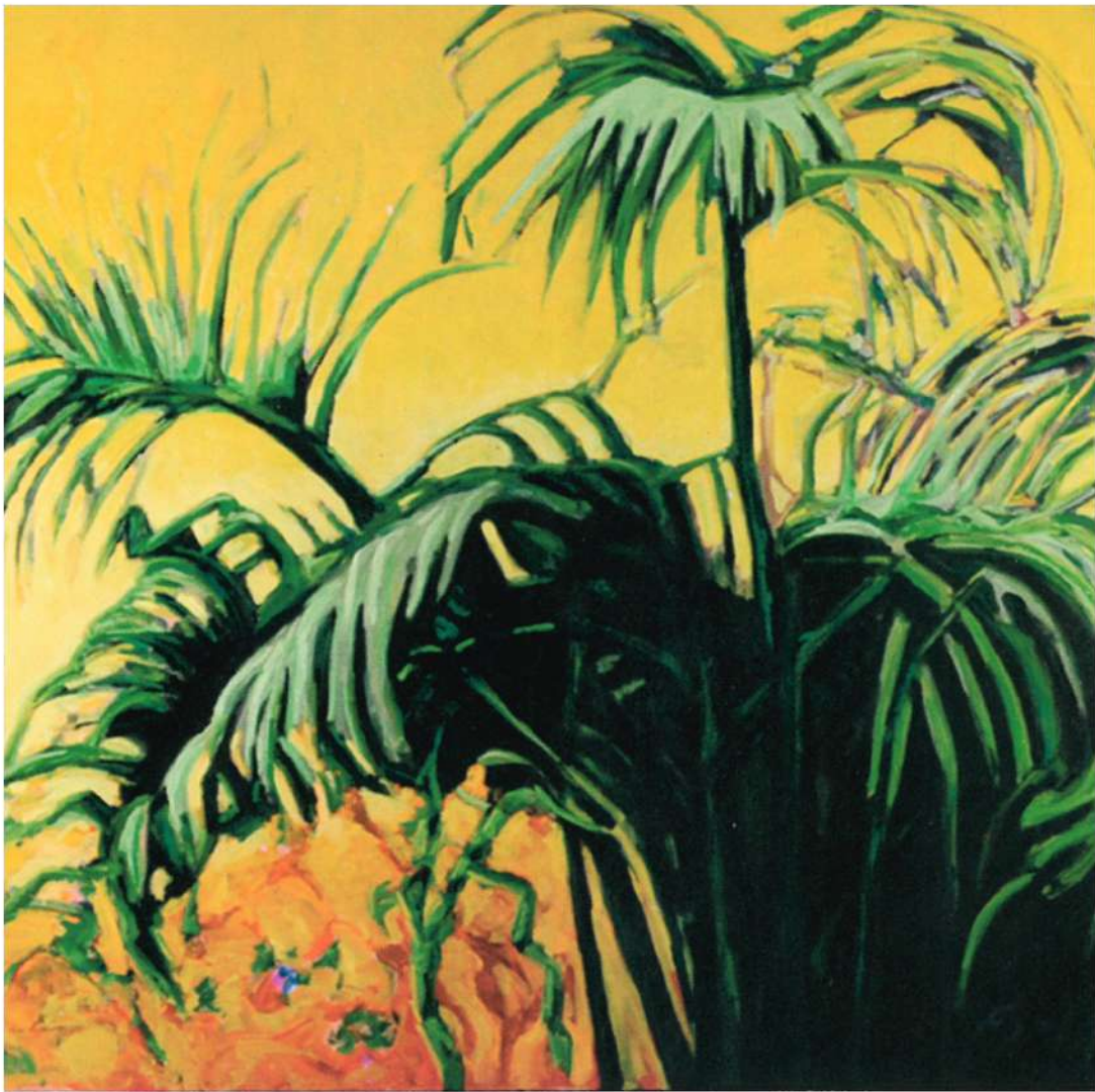
Ignacio Esplá, "Palmas", 1990