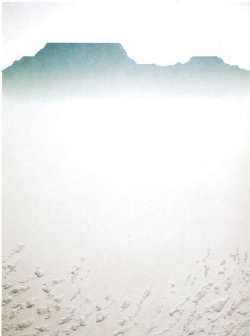
Carlos Poveda, "Tepuy III", 1987

naturalismo, presente en esta sala; la abstracción cromática del maestro Sinclair, hasta la introspección de los paisajes de vanguardia en la sala 7. No podemos olvidar la transición posromántica y simbólica de los paisajes en la sección que hemos denominado Arquitecturas en el Paisaje, así como la búsqueda de lenguajes surrealistas en la obra de Humberto Calzada, donde otorga un nuevo sentido al paisaje como representación del subconsciente.