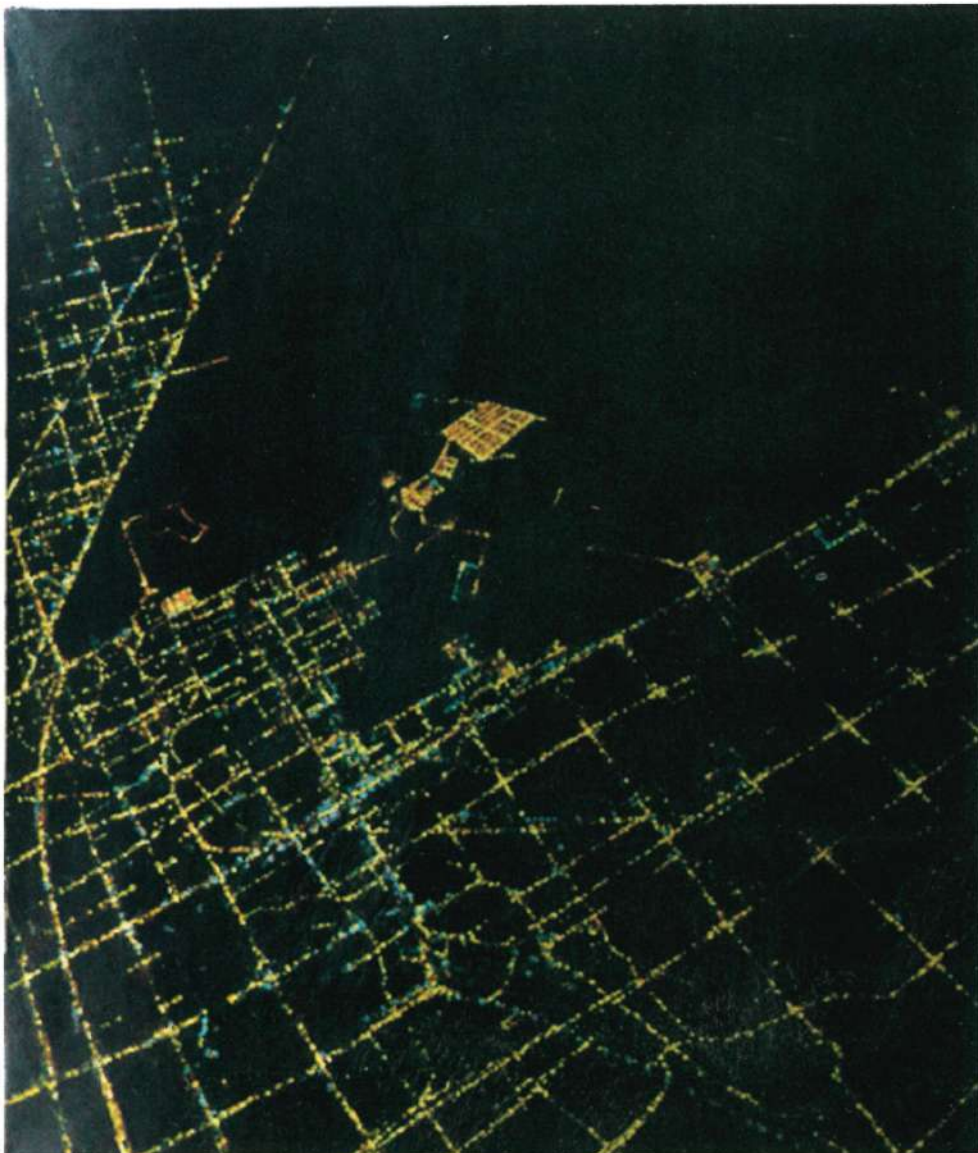
Gustavo Acosta, "No te lo pienses dos veces", 2009

Podemos observar diferentes periodos artísticos comprobando la evolución de los paisajes. Desde el