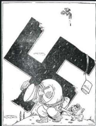
VIA CRUCIS... Semana de Dolor, en ...Anti-Nazi, 1946