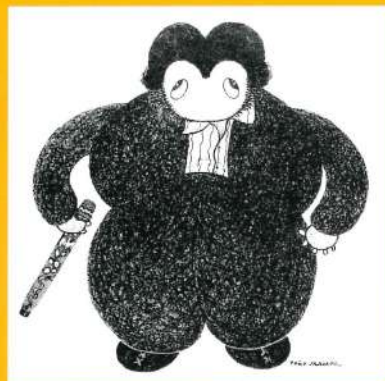
Diego Rivera, 1922