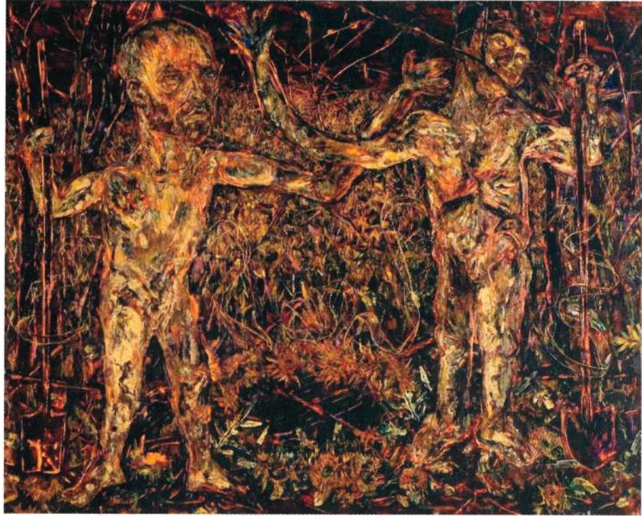
Arnaldo Roche-Rabell "Acaso no todos queremos enterrar a nuestros muertos" Oleo S/Tela 243.84 cms x 304.80 cms 2002