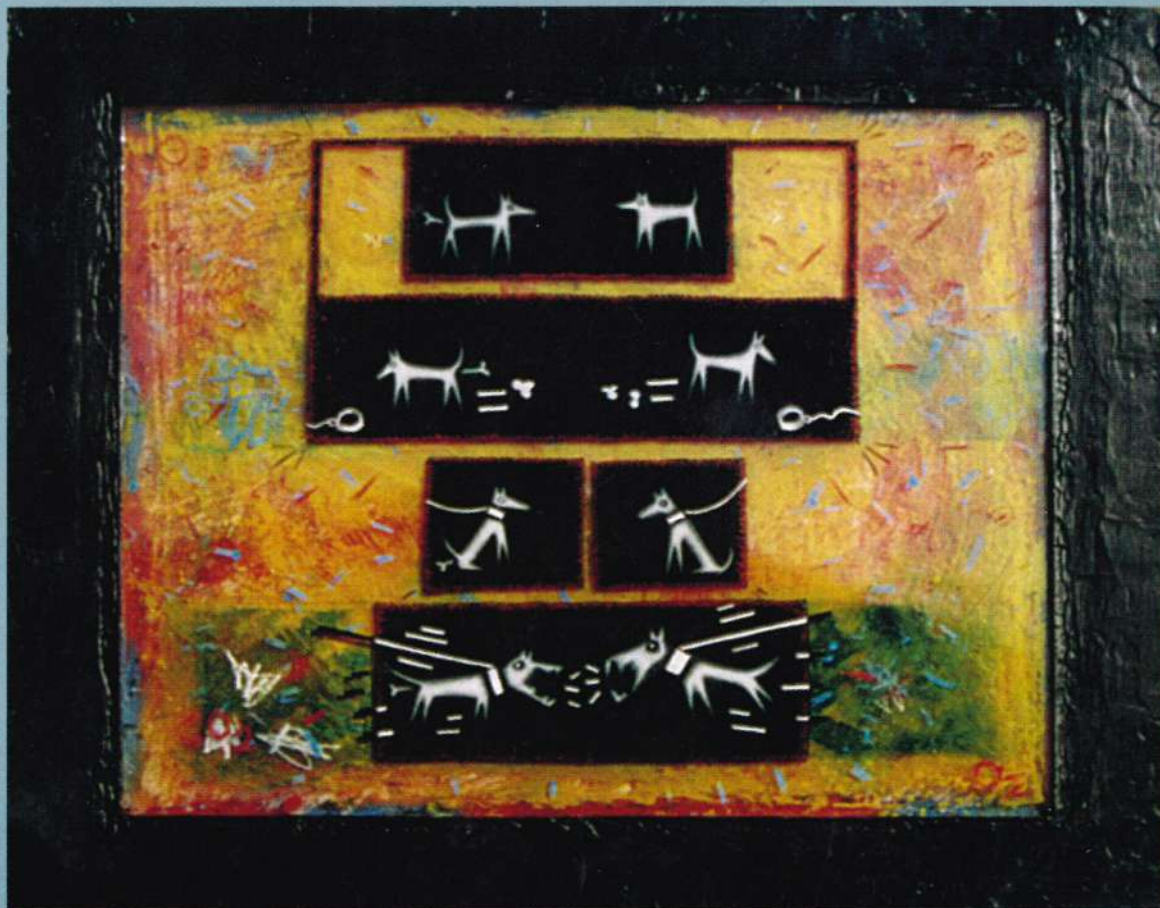
Juega vovi, 2003. Técnica mixta sobre acrílicos, 11" x 14"