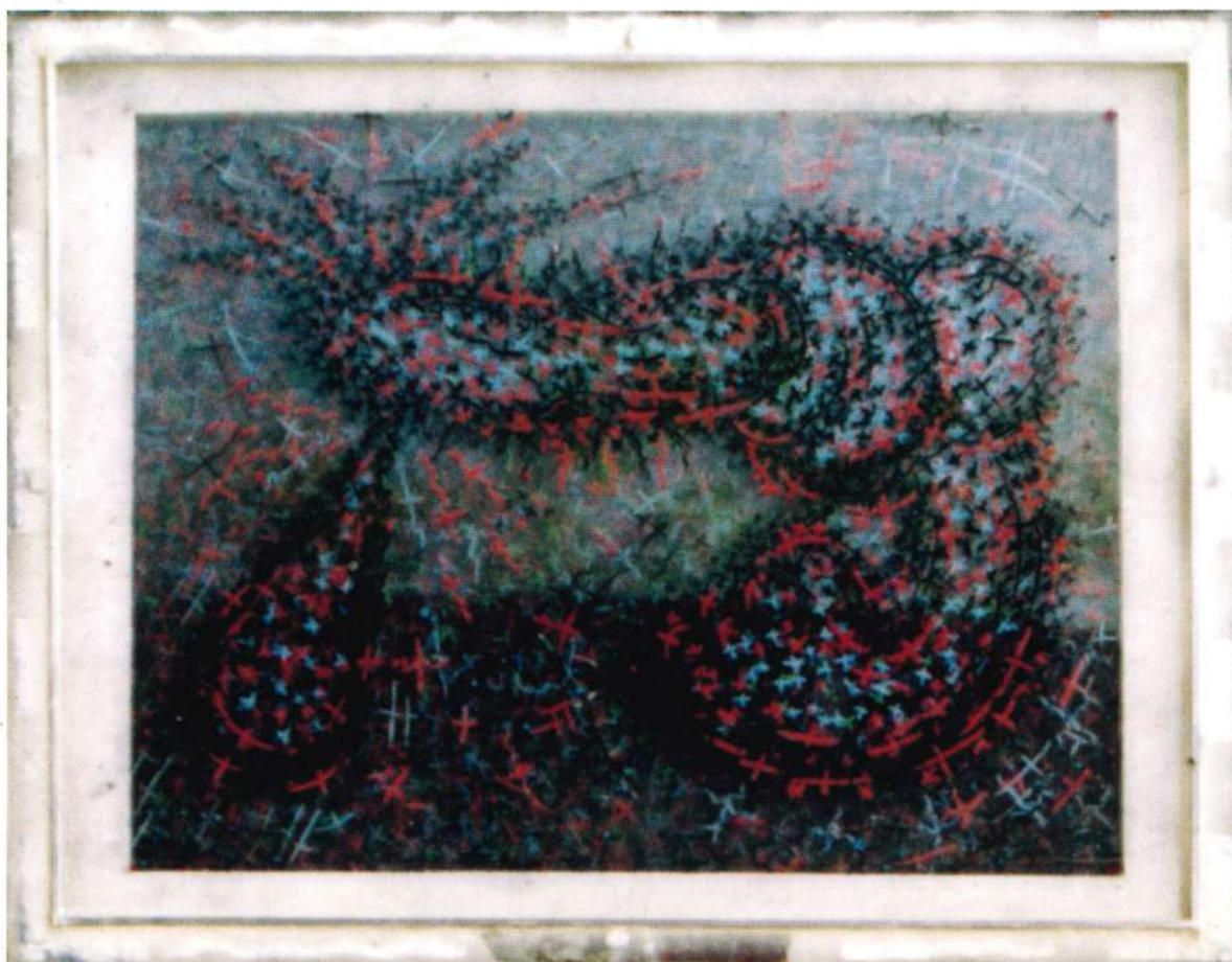
Danza, Socarrona, 2004 Técnica mixta sobre acrílicos, 11" x 14"

“Soy feliz, soy Panavovi y resido a veces mucho a veces poco, en cada uno de ustedes”