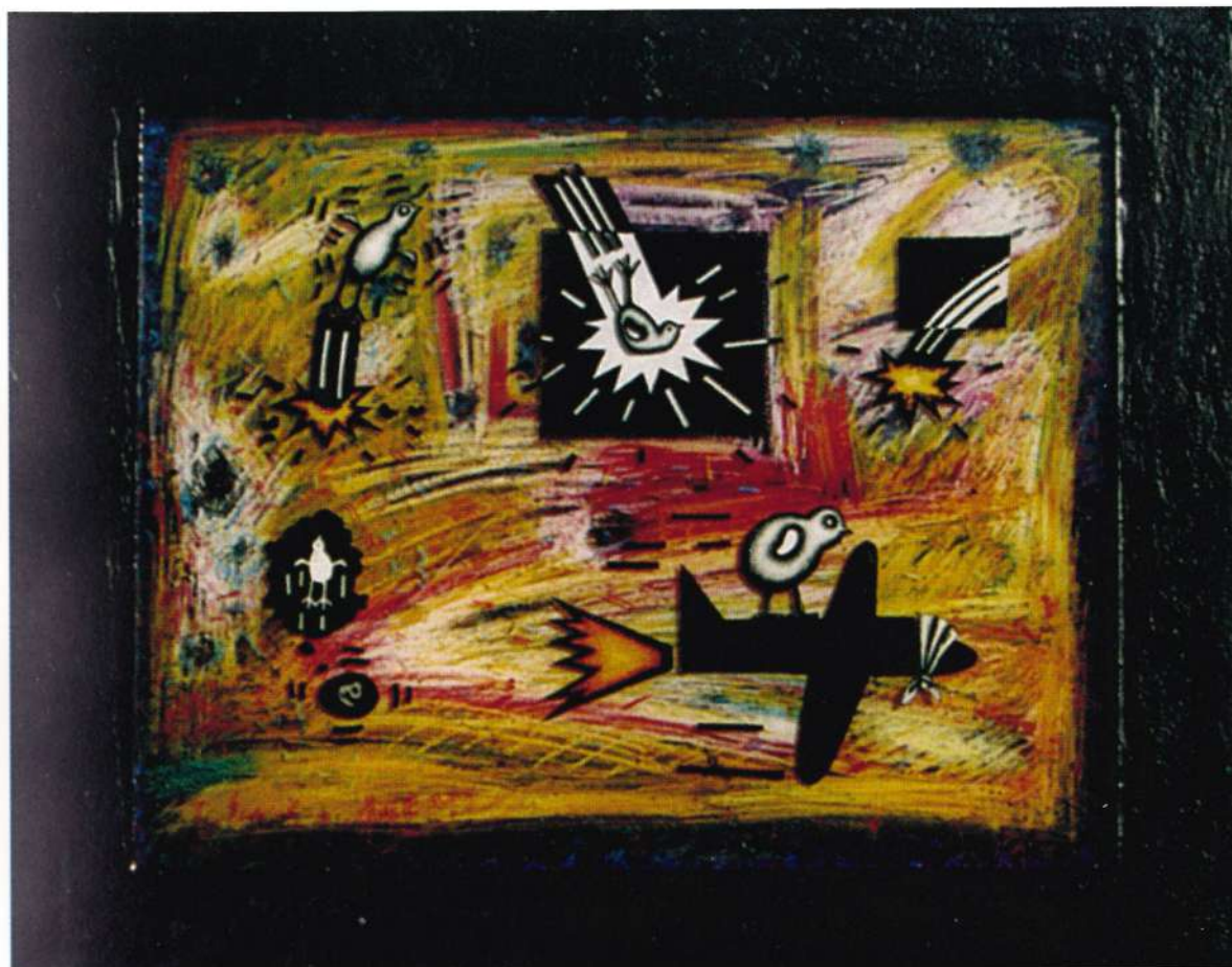
Poyito no quiere ser Poyito, 2003. Técnica mixta sobre acrílicos, 11" x 14"