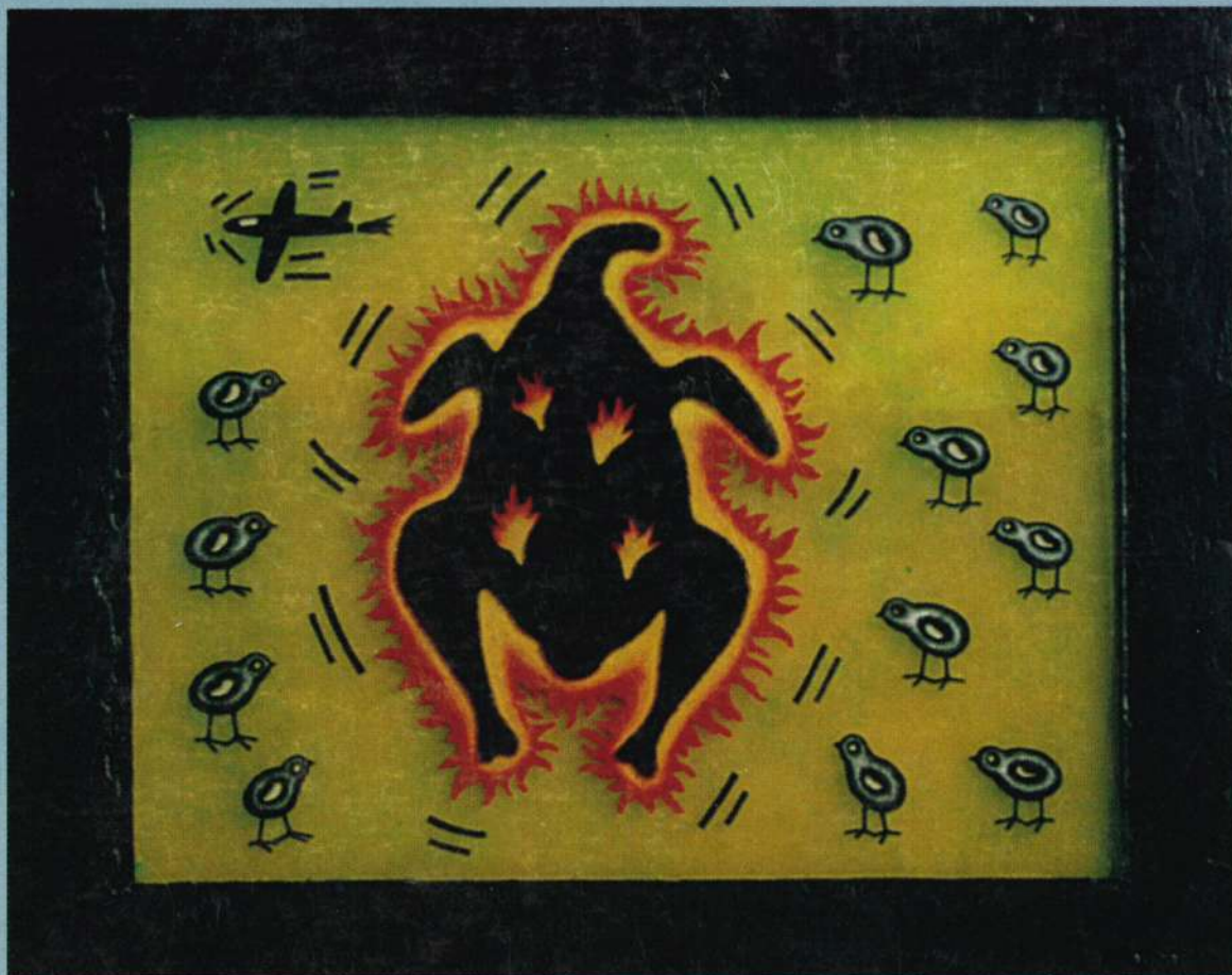
Poyito Death, 2002. Técnica mixta sobre acrílicos, 11" x 14"