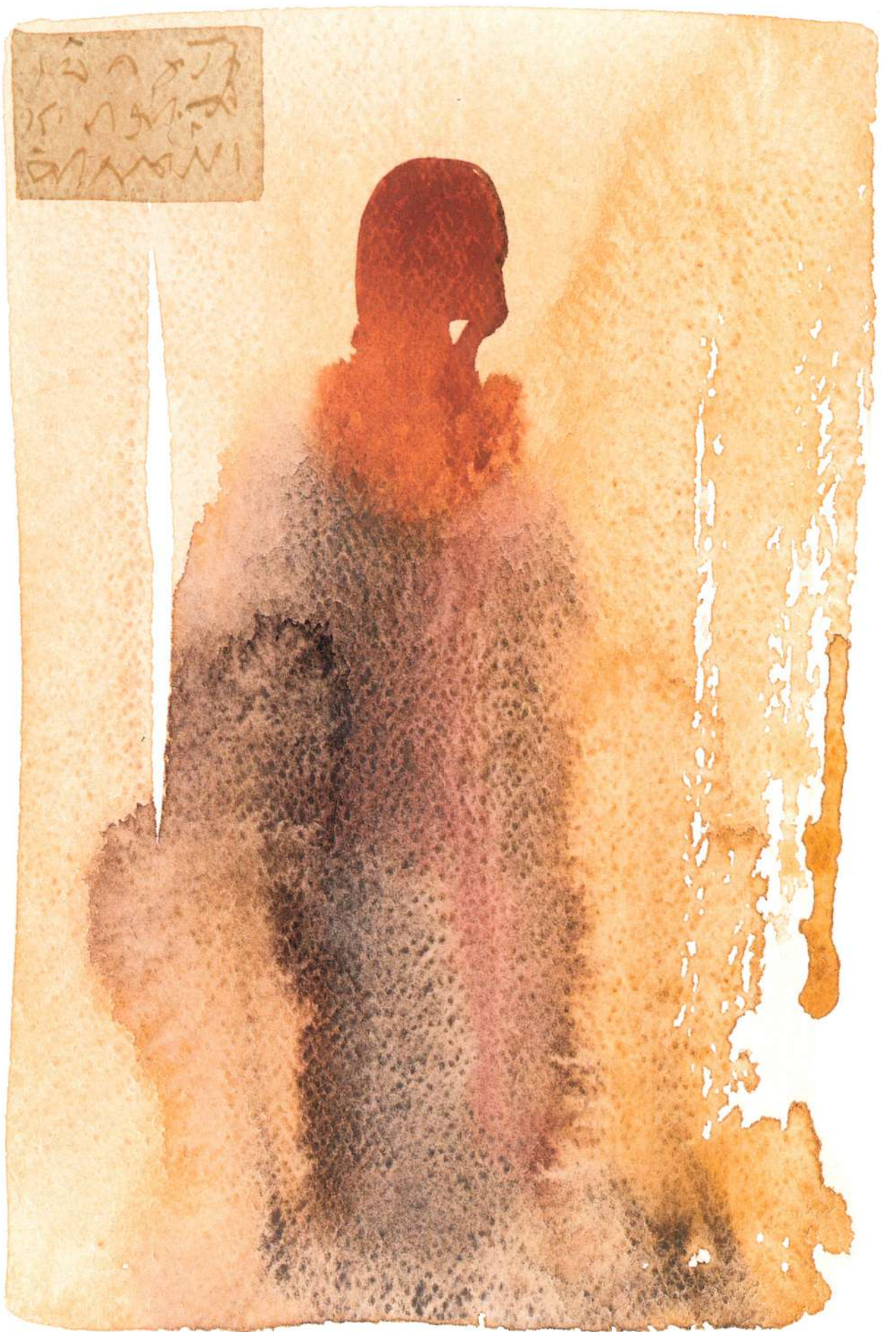
"Figura XXX", 2001, acuarela/papel, 12" X 9"