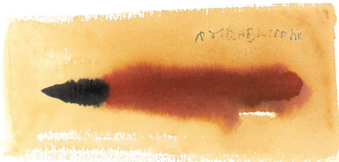
"Retaliation", 2001, acuarela/papel, 12" X 18"

Actualmente se encuentra trabajando en las obras que presentará para la VI Bienal de Arte de Panamá, a celebrarse en junio de este año en el Museo de Arte Contemporáneo de Panamá.