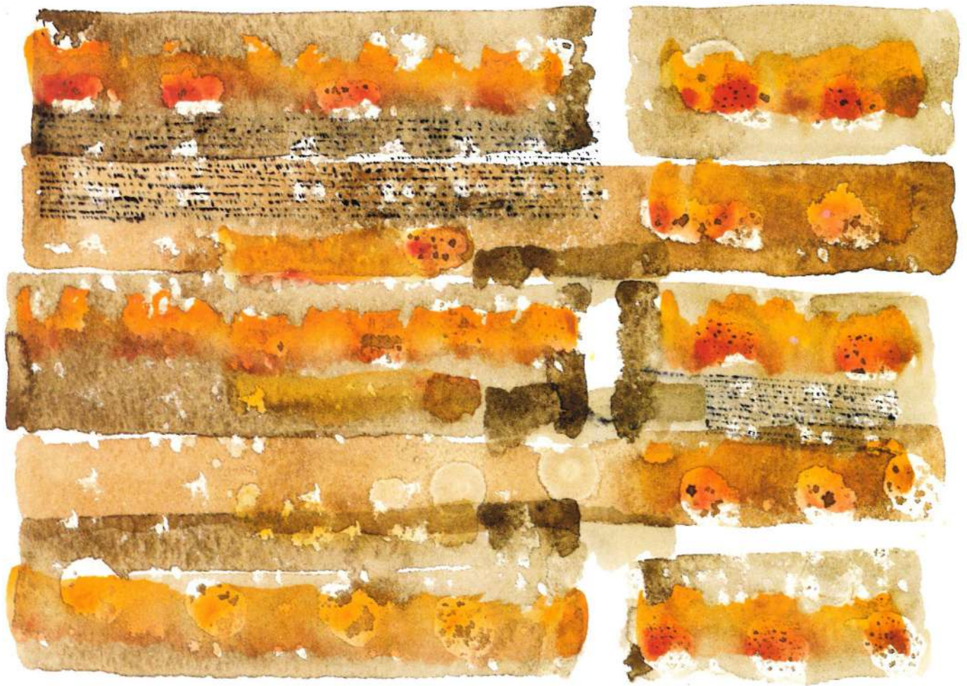
"Daño fatal del hipotálamo", 2002, acuarela/papel, 15" X 22"