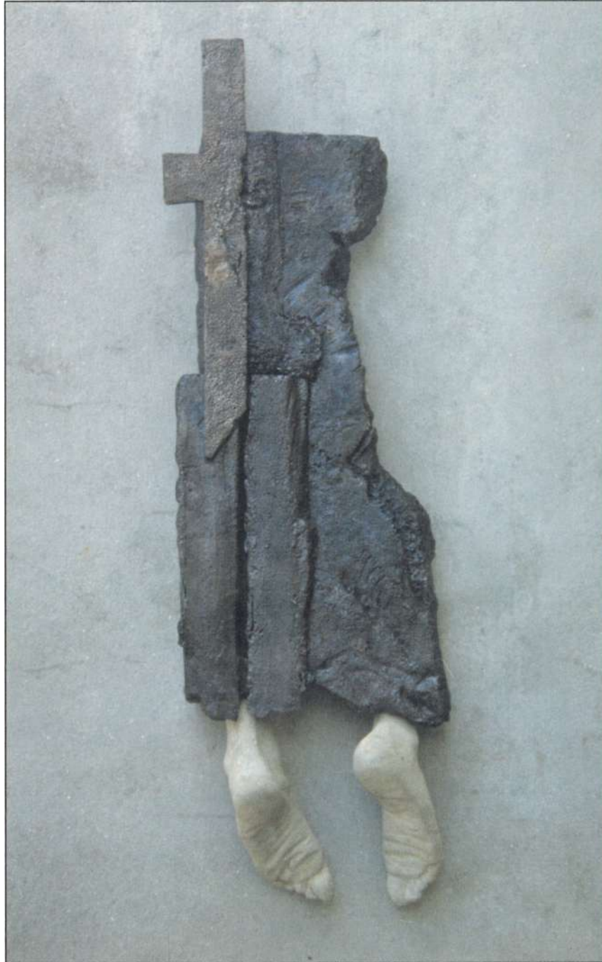
Ascensión; 120 cm x 37.5 cm x 16.25 cm; aluminio, cemento Ascension; 48" x 15" x 6.5"; aluminum, cement