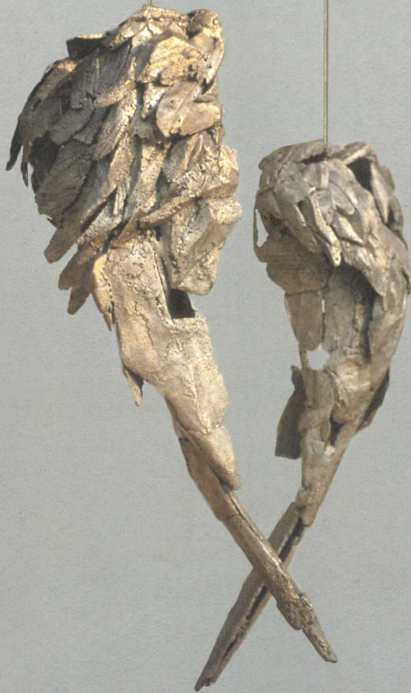
Pensamiento y Memoria; 130 cm x 37.5 cm x 36.25 cm; 122.5 cm x 40 cm x 30 cm; aluminio Thought and Memory; 52" x 15" x 14.5"; 49" x 16" x 12"; aluminum