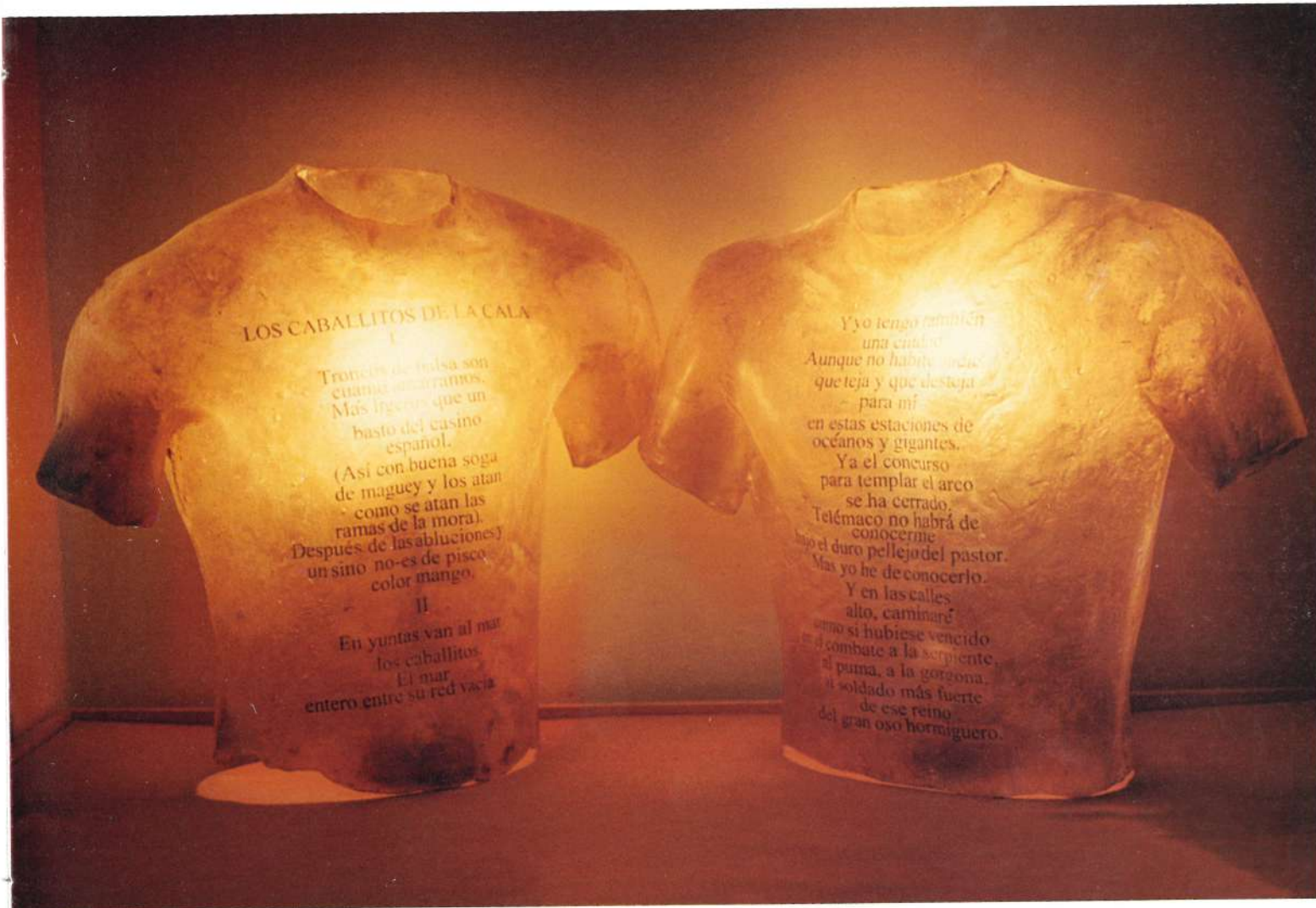
TORSOS Tamaño natural Molde directo, resina y texto. 2000.