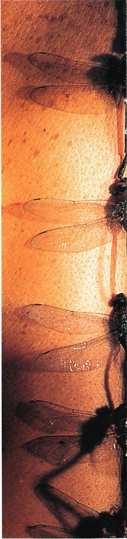
EL VUELO. Fotografía con intervención digital. Jaime Davi