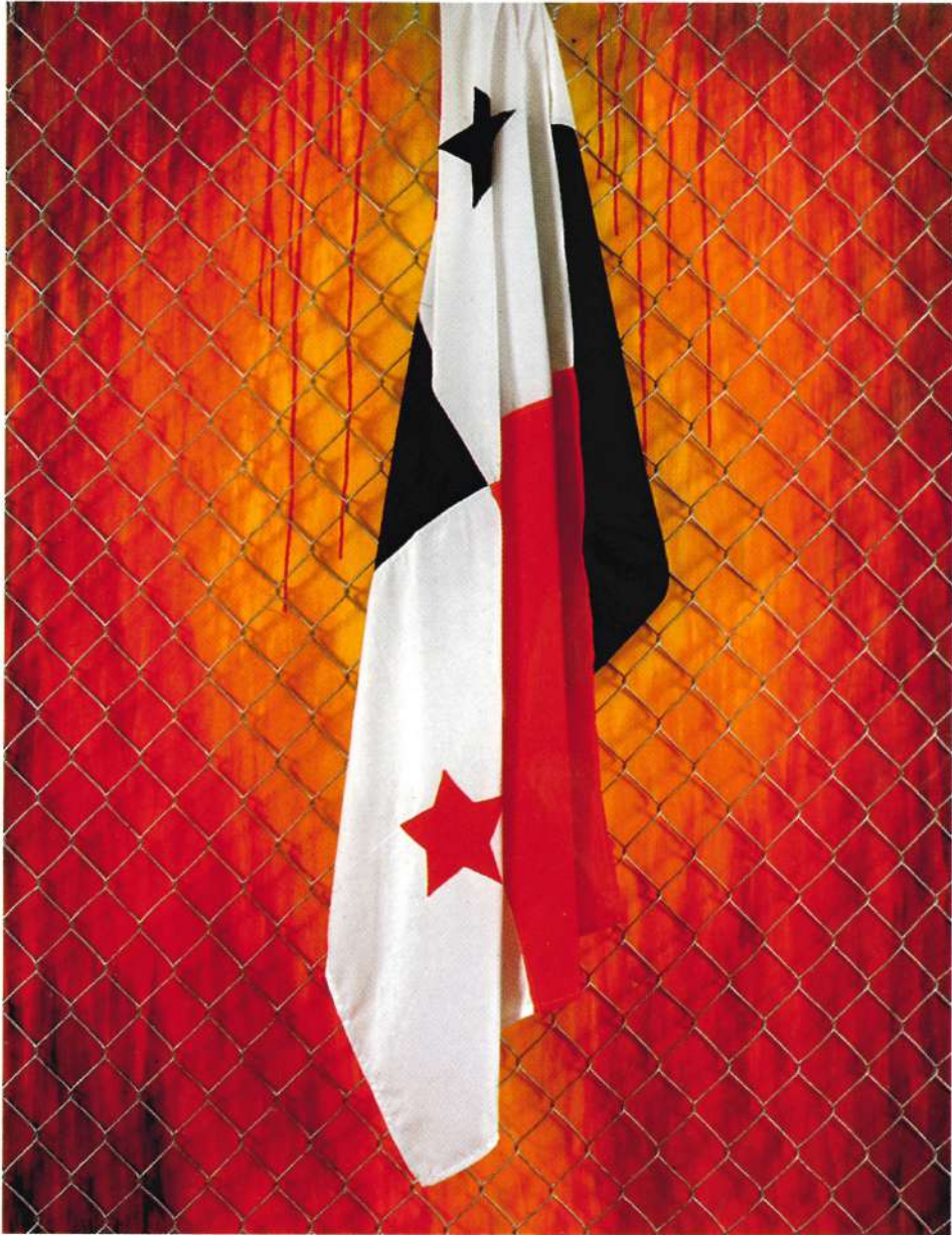
"9 de Enero", 60" x 48", técnica mixta, 1999