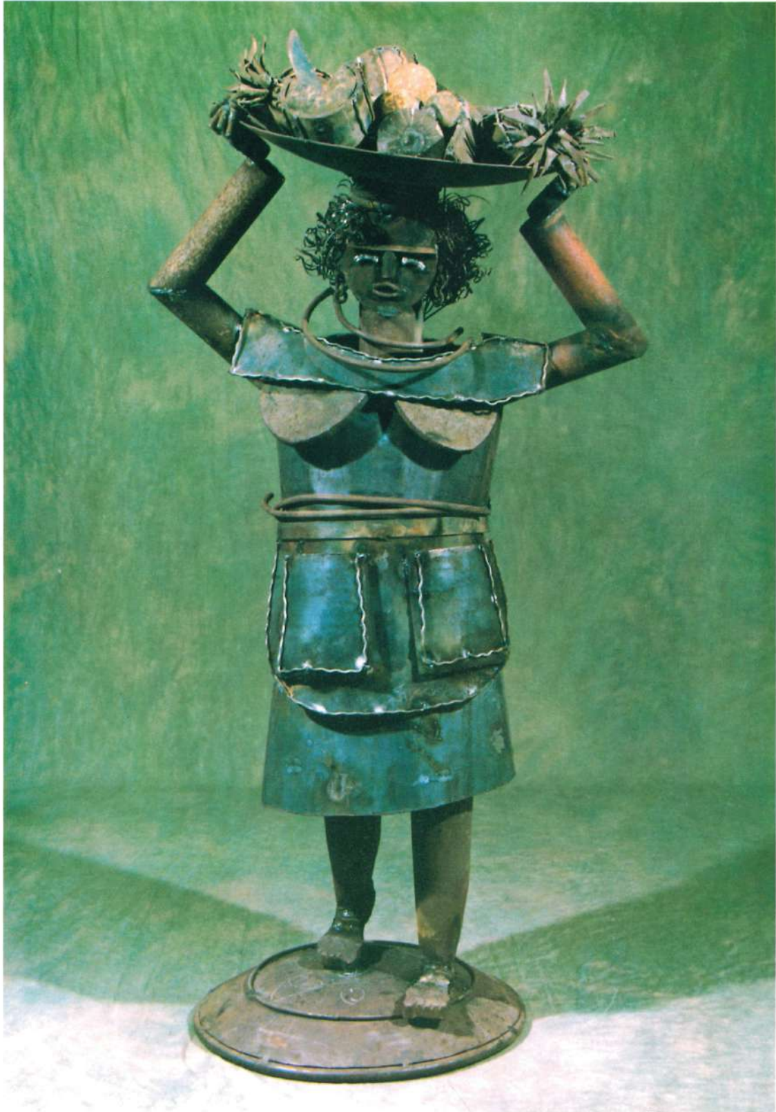
"PALENQUERA VENDEDORA DE FRUTAS" ENSAMBLAJE EN ACERO 0.70 x 0.50 MTS. ALTURA 1.40 - PESO 75 KG.