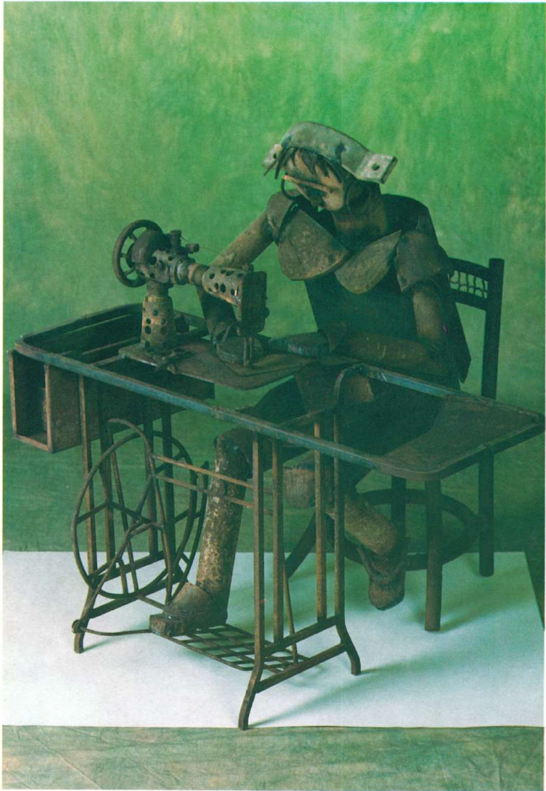
"MUJER COSIENDO" ENSAMBLAJE EN ACERO 0.92 x 0.80 MTS. ALTURA 0.92 MTS. PESO 63 KG.