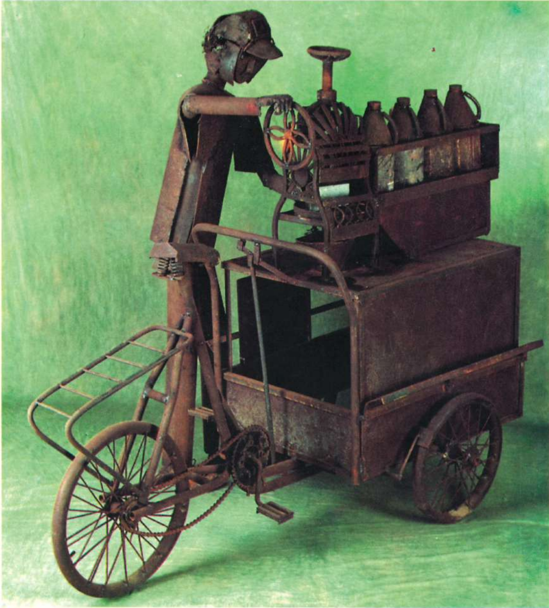
"VENDEDOR DE RASPAO" ENSAMBLAJE

1.65 x 1.03 MTS. ALTURA 1.18 MTS. PESO 112 KG.