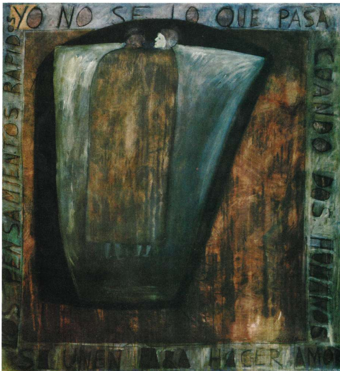
"RELACIONES" ACRILICO SOBRE TELA 78 X 70" 1999