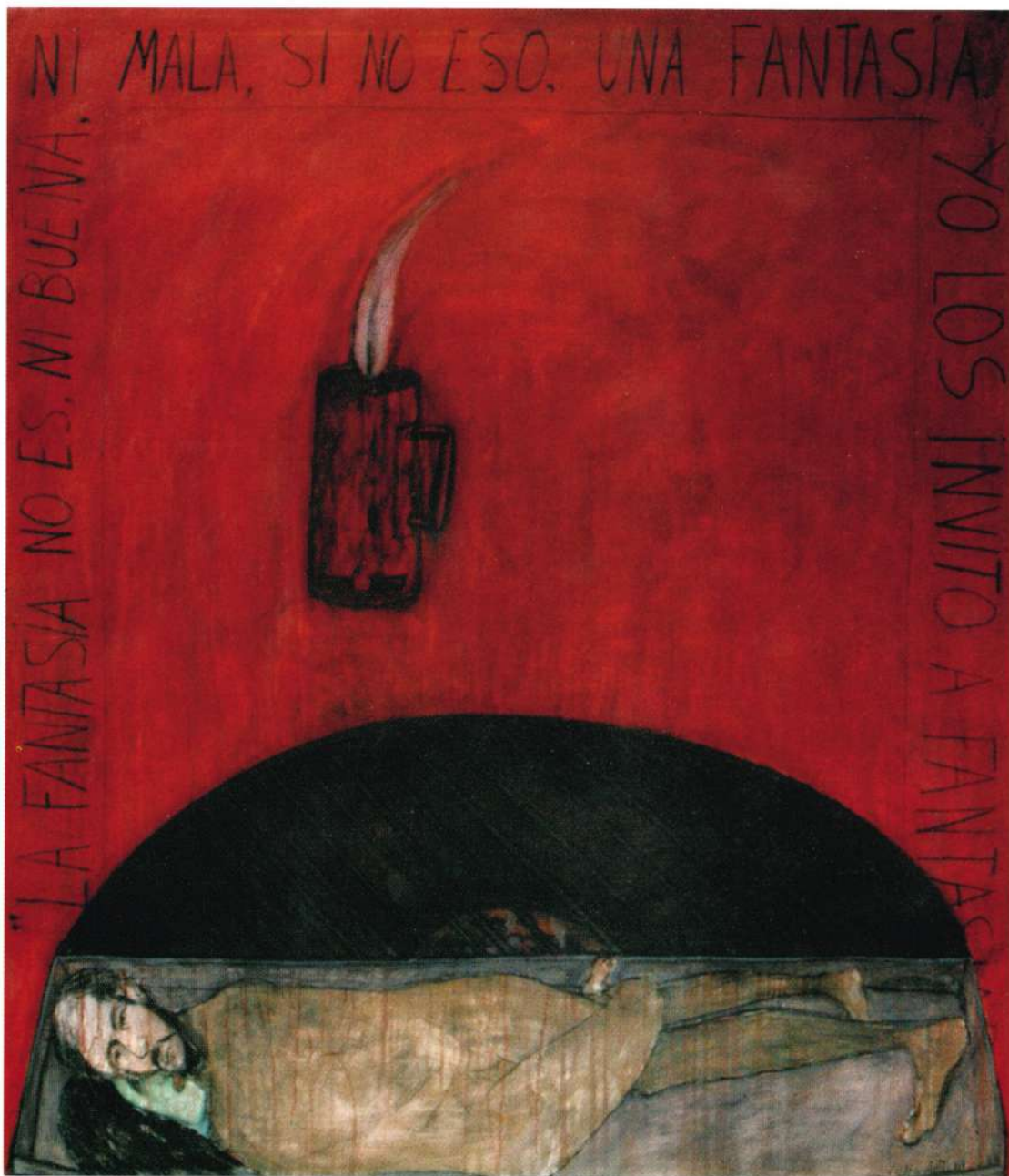
"NI BUENA NI MALA" ACRILICO SOBRE TELA 78 X 70" 1999