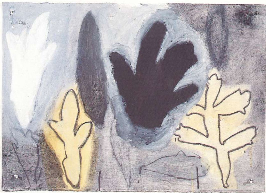
"MANOS/HELECHOS" de la serie "Cuadernos", técnica mixta, 20 x 30", 1995.