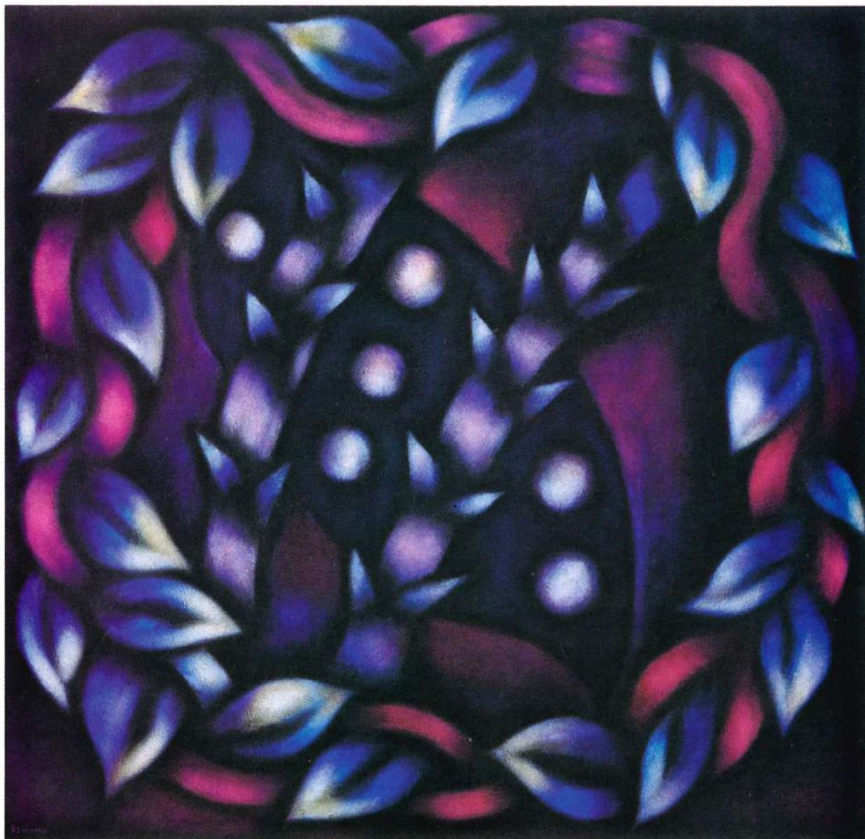
“LUNAS ROMANAS” Acrílico sobre lienzo - 48 x 50” - 1994