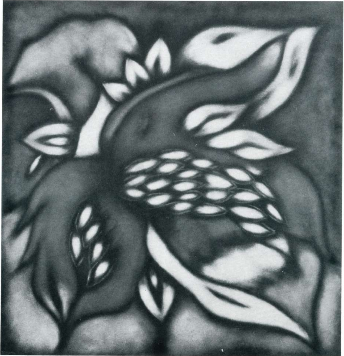
“TRANSFIGURACION” Acrílico sobre lienzo - 50 x 48” - 1994