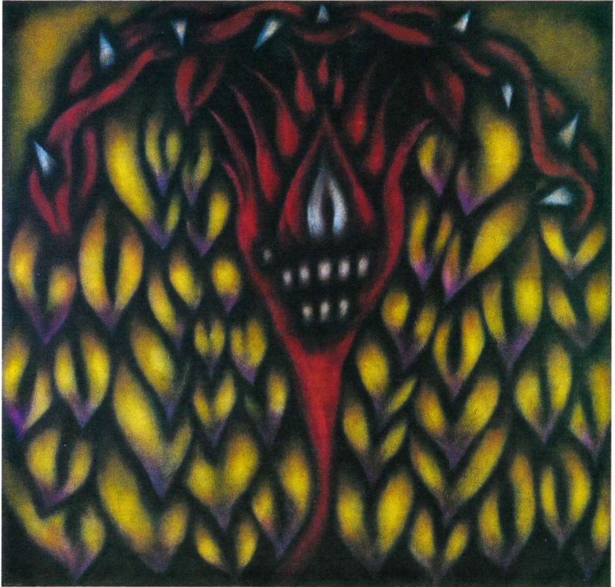
"ANIMA MUNDI" Acrílico sobre lienzo - 48 x 50" - 1994