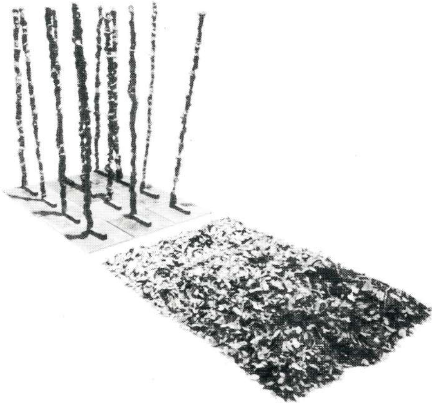
Karen A. Rifas Instalación, 1991 Bronce, "Grid of Leaves" 50" x 36" x 100"