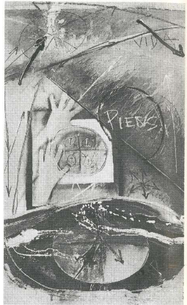
"Un si positivo" Técnica mixta sobre papel

"Dibujo lo que siento al emitir el rugido de mi OM interior. Dibujo sobre cualquier superficie, dura o blanda, blanca o negra. Dibujo acostada, parada, apoyada sobre mis rodillas. Puedo estar desnuda o vestida, dependiendo de cómo me sienta. Dibujo en el aire, caminando en el parque, en la calle, en cualquier tienda, en un bar, por supuesto también en mi estudio. Dibujo en la cocina mientras cocino, con mi lengua frente al espejo, con pintura de labios sobre mi cara, con mis pies debajo de la mesa mientras como. Dibujo en la arena de la playa, en el barro del patio de mi casa en mi pueblecito natal".