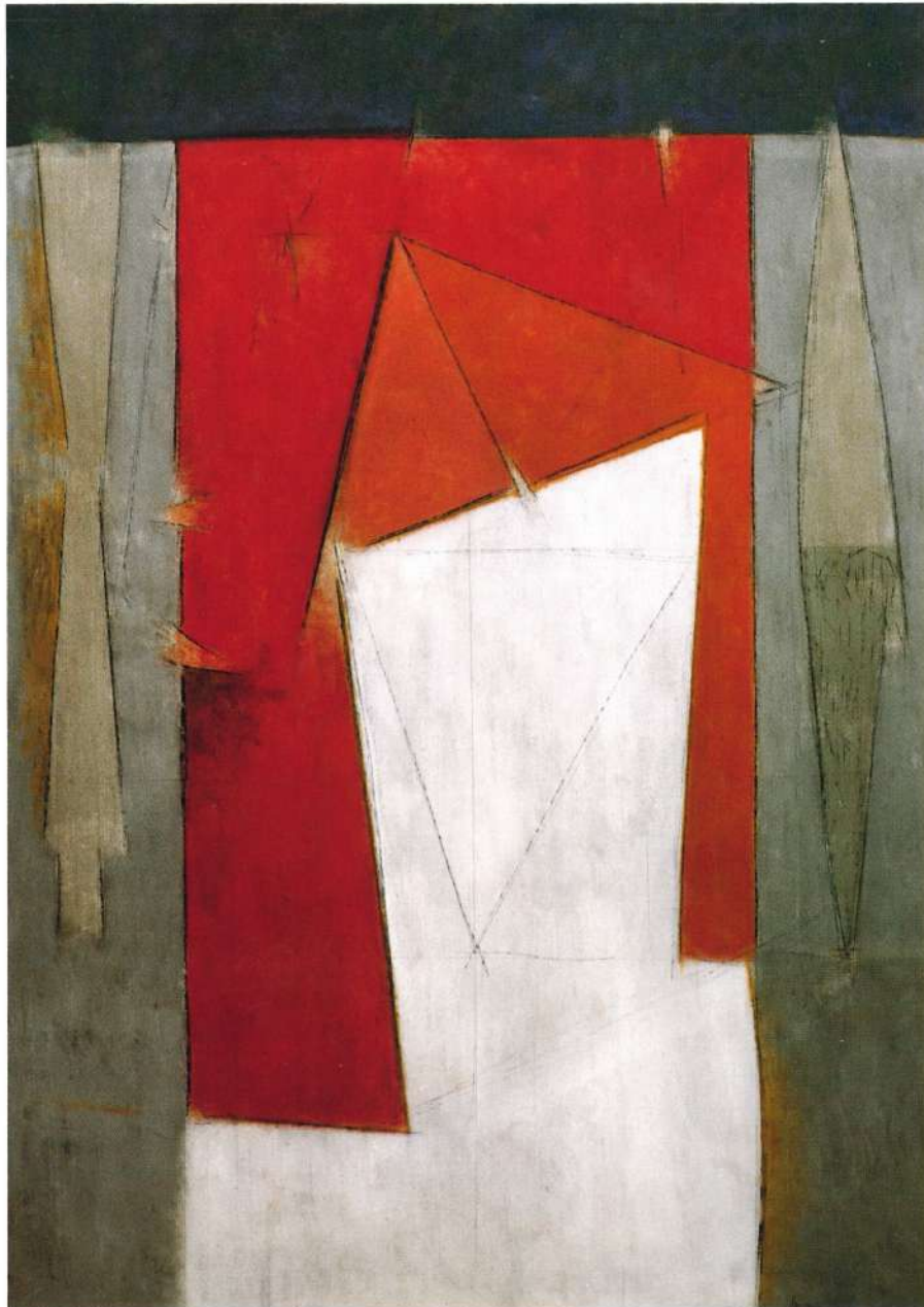
"GRAN SUEÑO" ACRILICO EN TELA, 67 X 47 PULGADAS, 1992