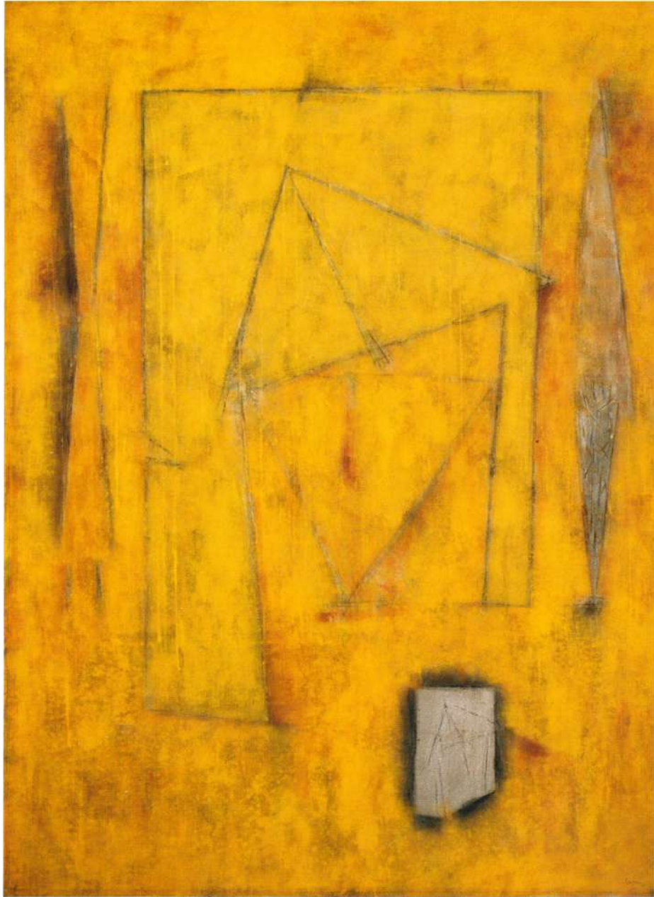
"TEXTO LABIO" ACRILICO EN TELA, 59 X 43 PULGADAS, 1992