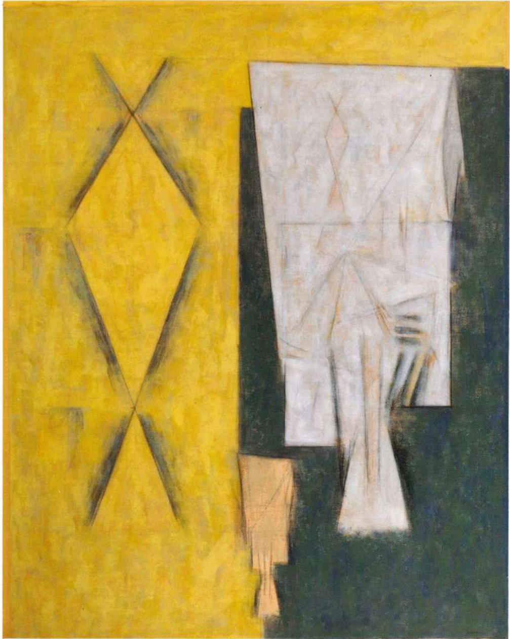
"MIRANDOTE" ACRILICO EN TELA, 55 X 43 PULGADAS, 1992