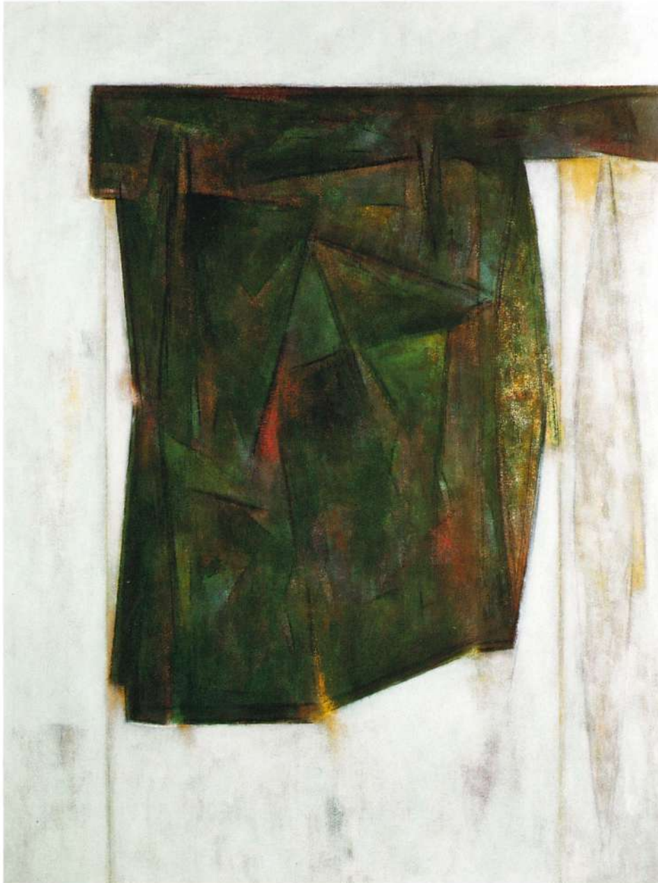
"VERDE CANCION" ACRILICO EN TELA, 47 X 35 PULGADAS, 1992