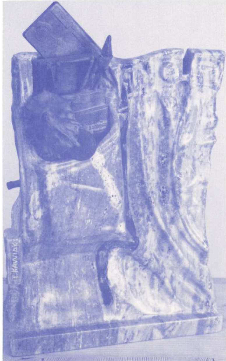
"Está en el bote" 1991 Mármol verde de Carrara Altura: 40 cm.