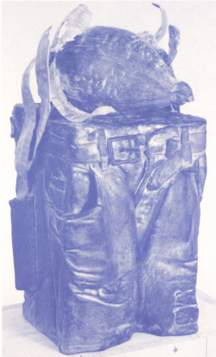
"Souvenirs de Contadora" 1991 Bronce Patinado Altura: 50 cm.