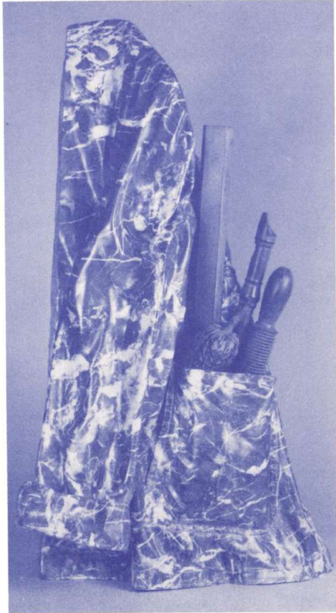
"Una Chaqueta" 1990 Mármol de Carrara y Bronce Altura: 80 cm.