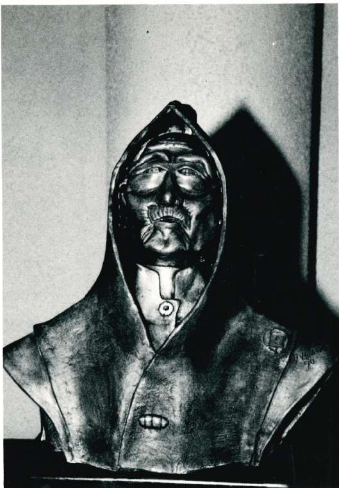
"En el nombre de la Rosa", escultura en cerámica, Dickey Velarde.