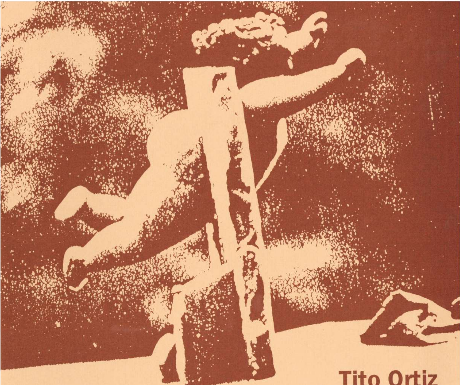
Tito Ortiz Esculturas