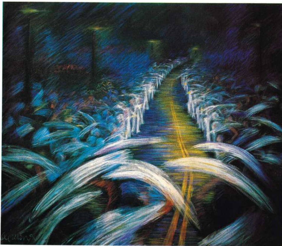
9. UNIDAD: DUELO Y PROTESTA Acrílico sobre tela 46" x 60"

Laurderdale, Florida 1987 "Arte Consult: 6 Years with Latin America" - Aleman Galleries, Boston, Massachusetts 1987 "Latin American Treasures from Miami's Private Collections" Center for the Fine Art - Miami, Florida