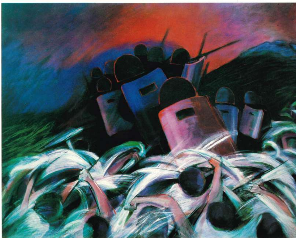
2. AGRESION ARMADA DE PANUELOS BLANCOS Acrílico sobre tela 46" x 60".

Academia Julién - París, Francia Exposiciones Individuales