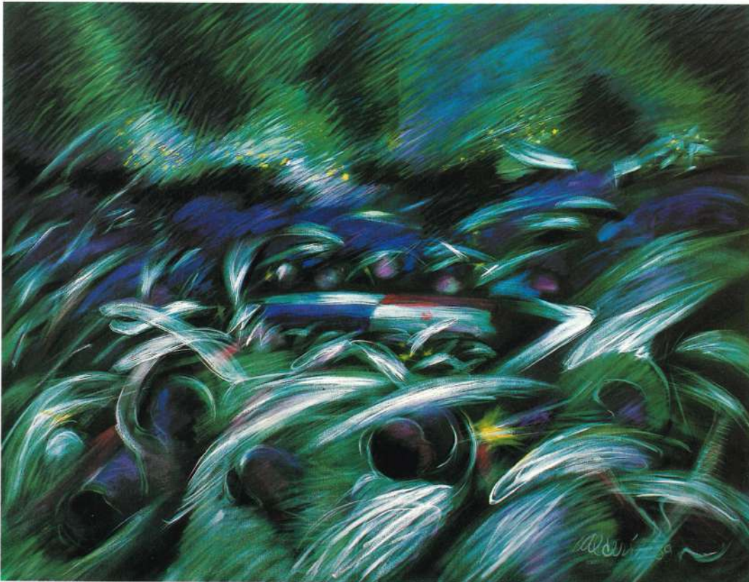
1. VIERNES NEGRO Acrílico sobre tela 46" x 60"