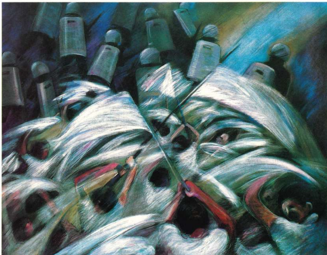
14. EL CAMINO SE ABRE...? Acrílico sobre tela 60" x 70"