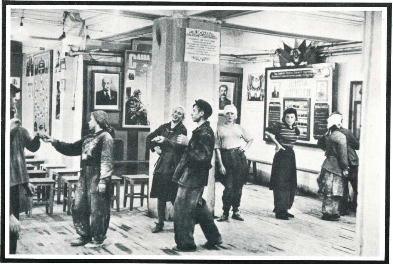
Cantina de los trabajadores en la construcción del Hotel Metropol, Moscú, 1954