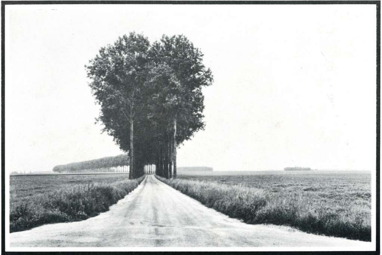
Brie, Francia, 1968