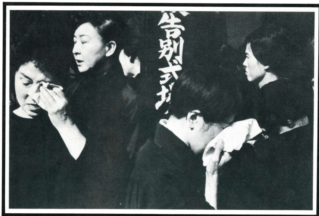
Funeral de un actor Kabuki, Japón, 1965