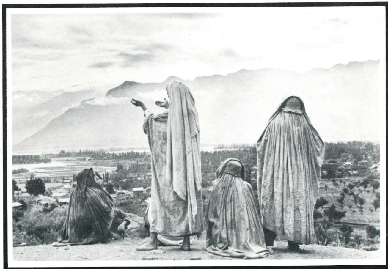
Srinagar, Cachemira, 1948