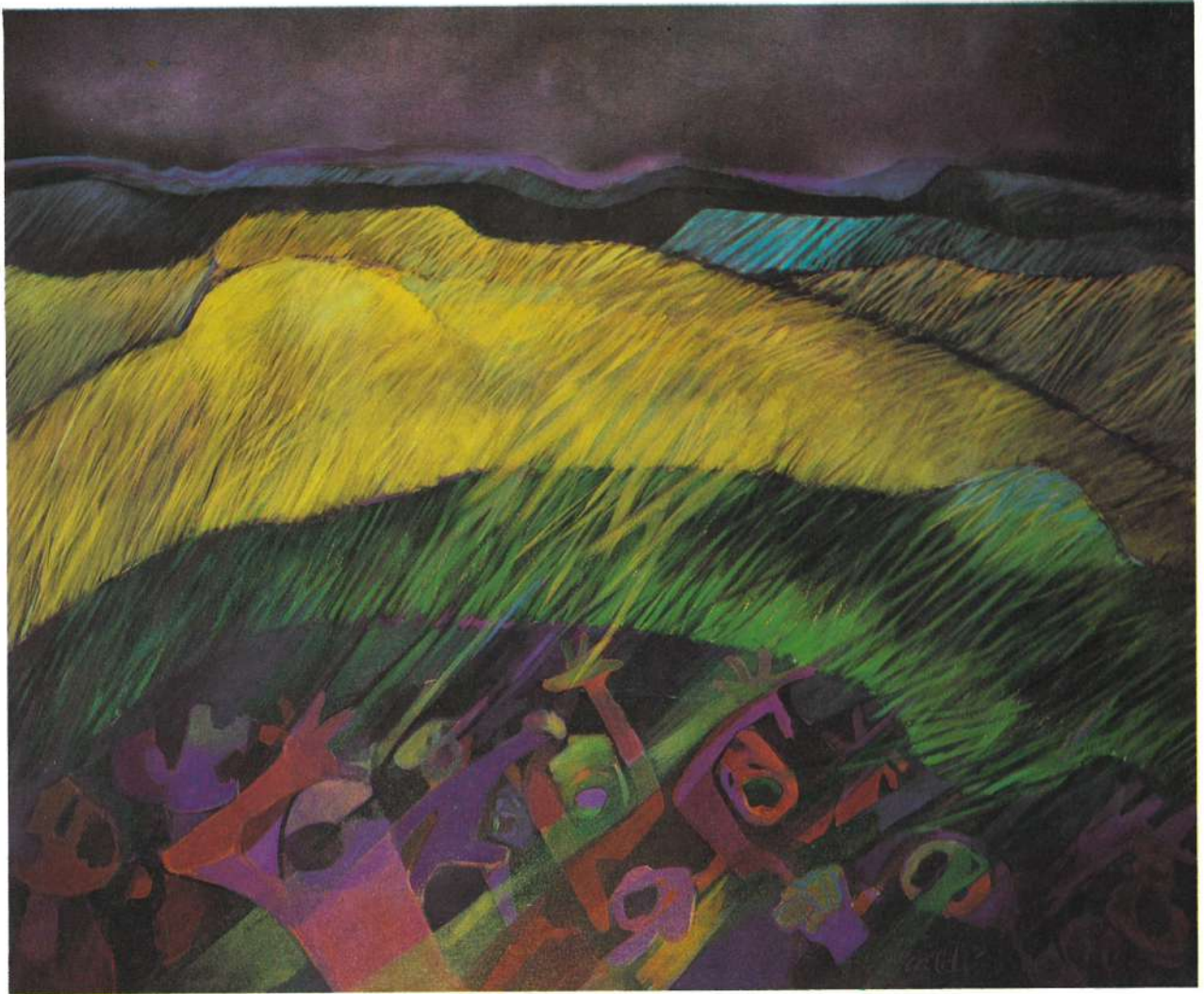
PROTESTA, 1985, ACRILICO