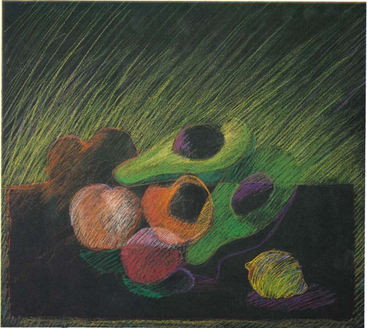
EL LIMON, 1986, PASTEL