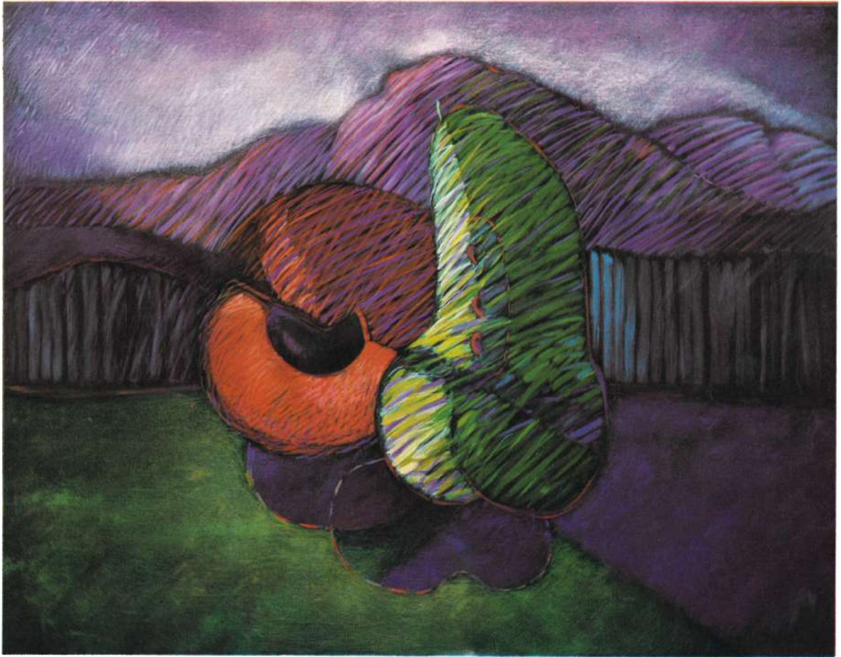
PERA ABOTONADA, 1986, ACRILICO