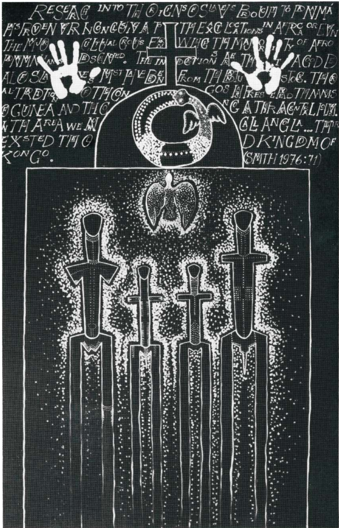
"Familia Cimarrona" Acrílico 65" x 42" 1994