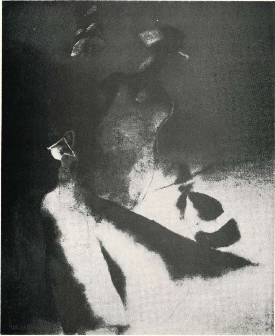
PASTEL — No. 1