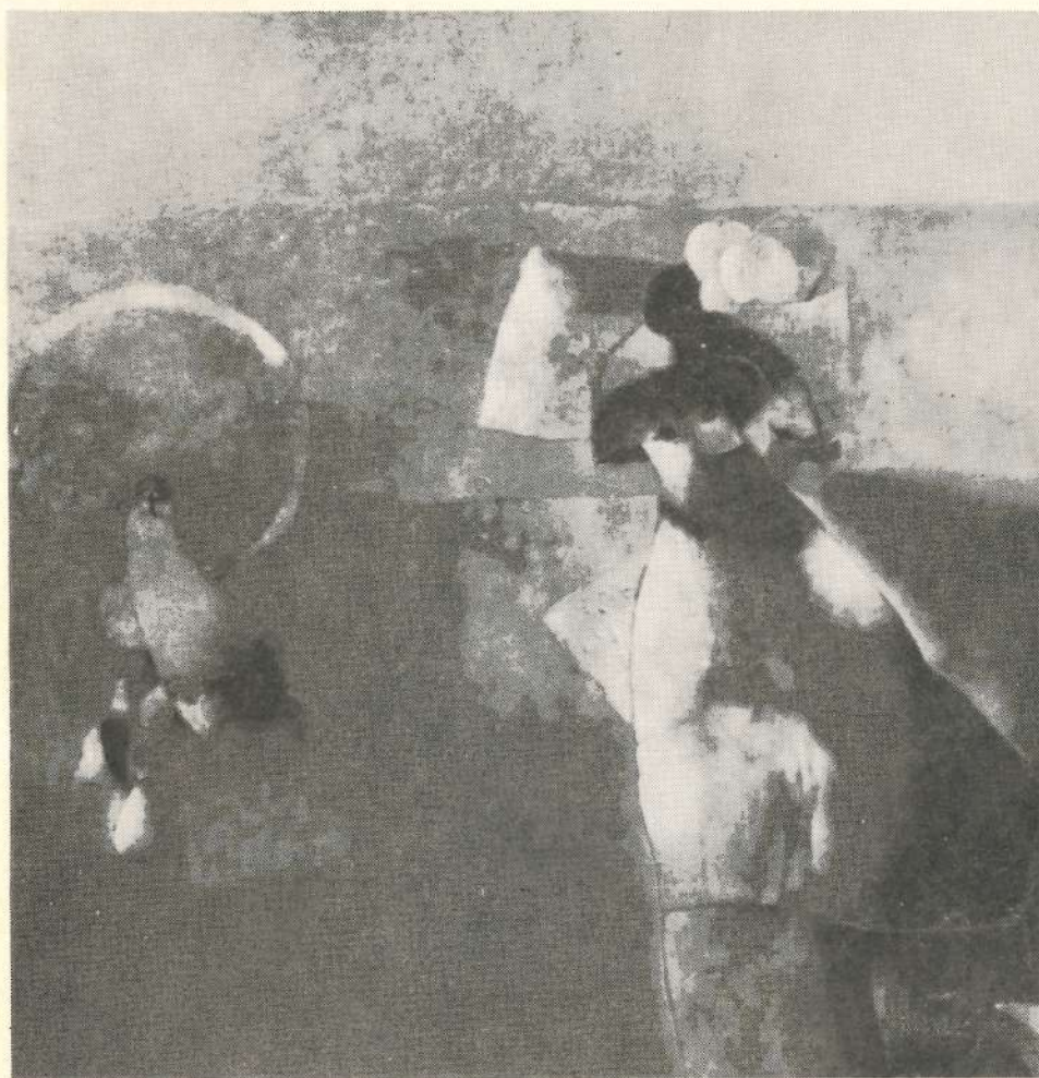
LA ESPANTAPAJAROS VENEDORA DE FRUTAS AMARILLAS - OLEO