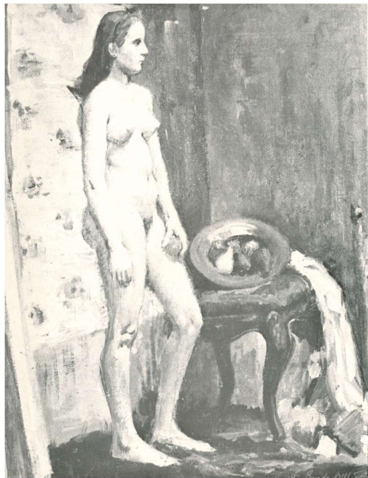
DESNUDO FEMENINO, 1946