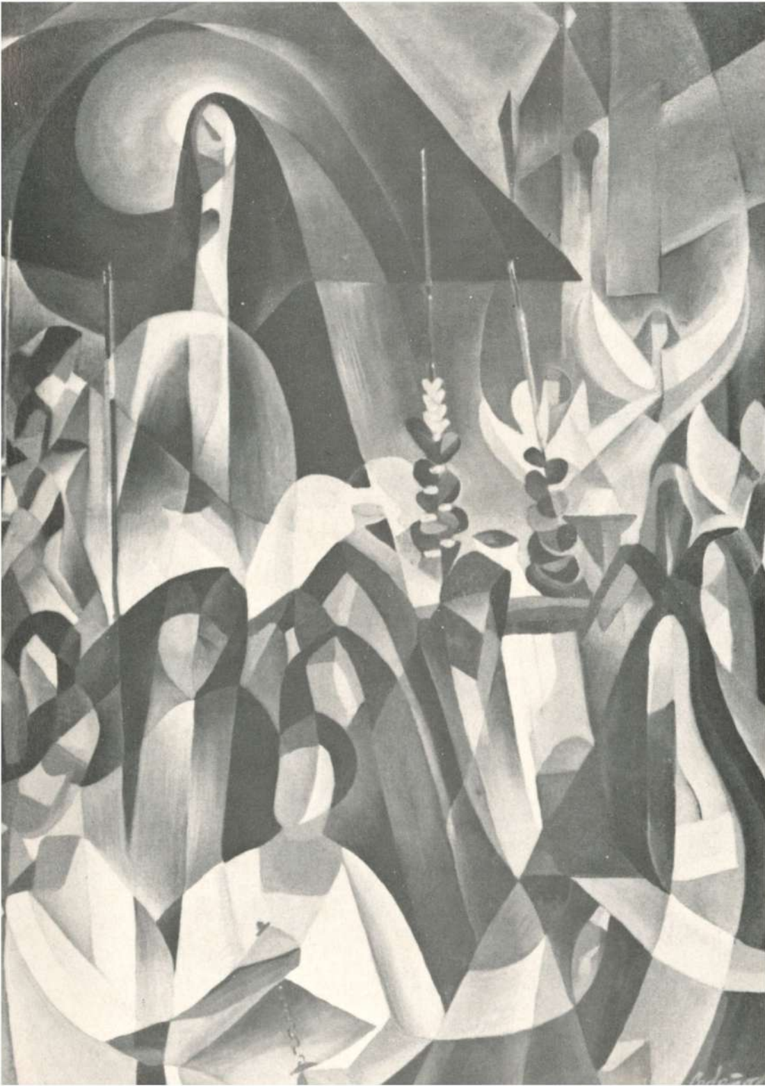
"VIERNES SANTO", 1951