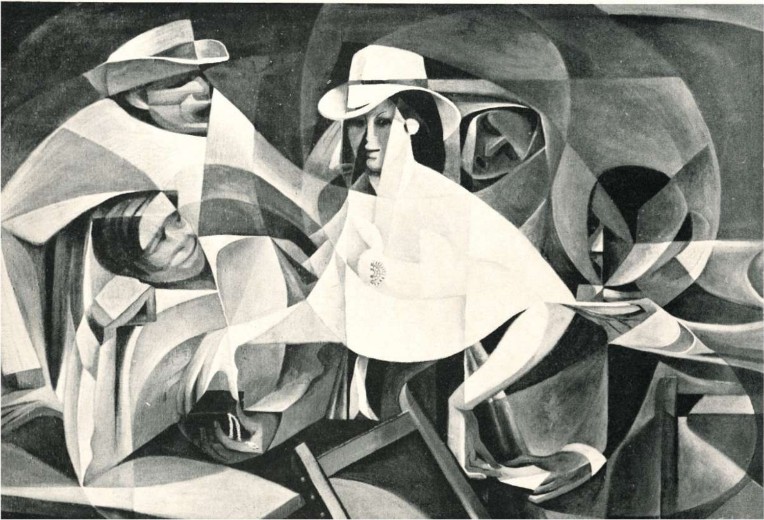
LAS CELESTINAS (VERSION), 1967