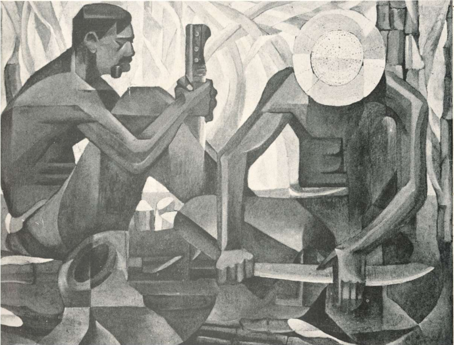
LA SIESTA (CAÑA AMARGA), 1952