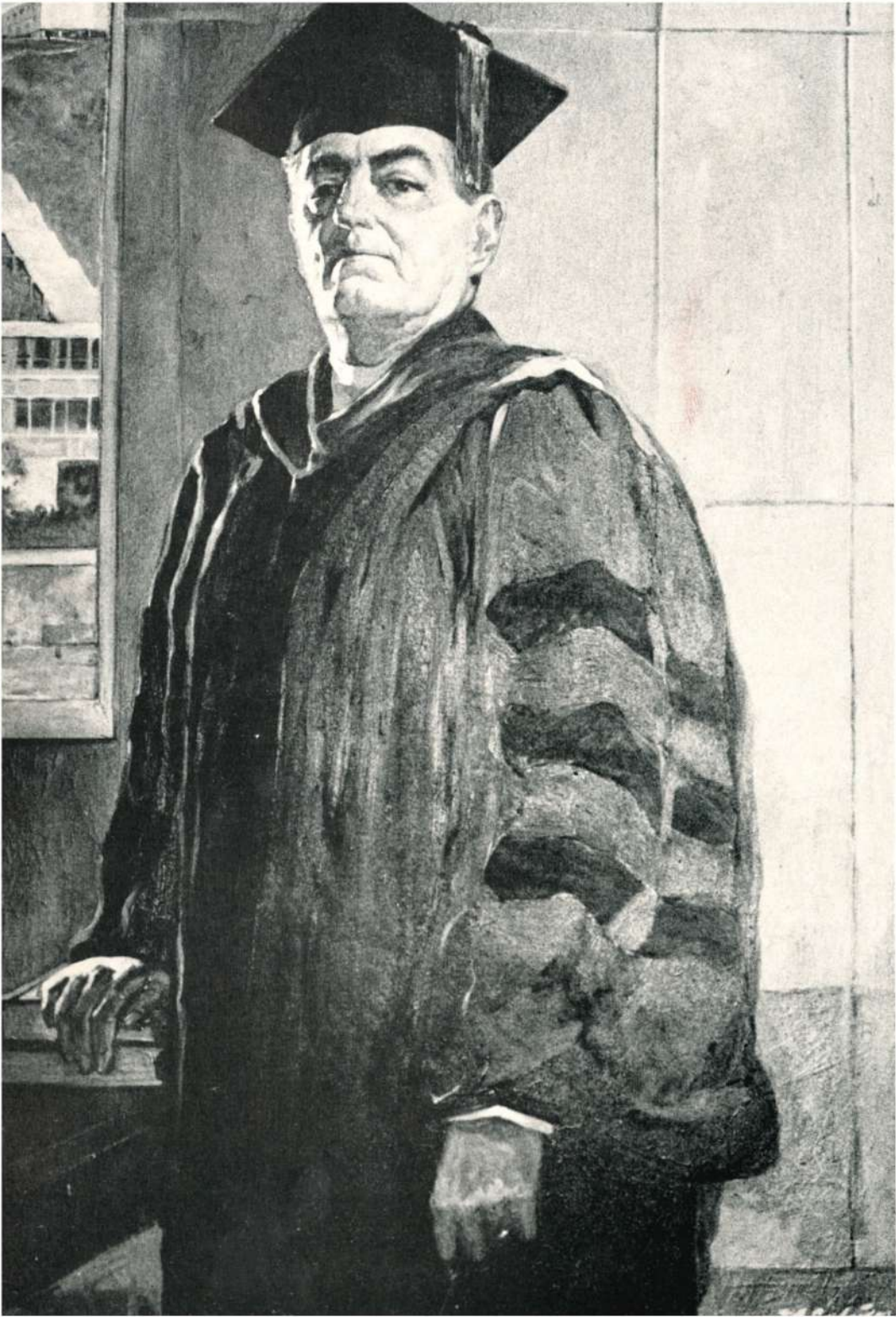
OCTAVIO MENDEZ PEREIRA, 1950