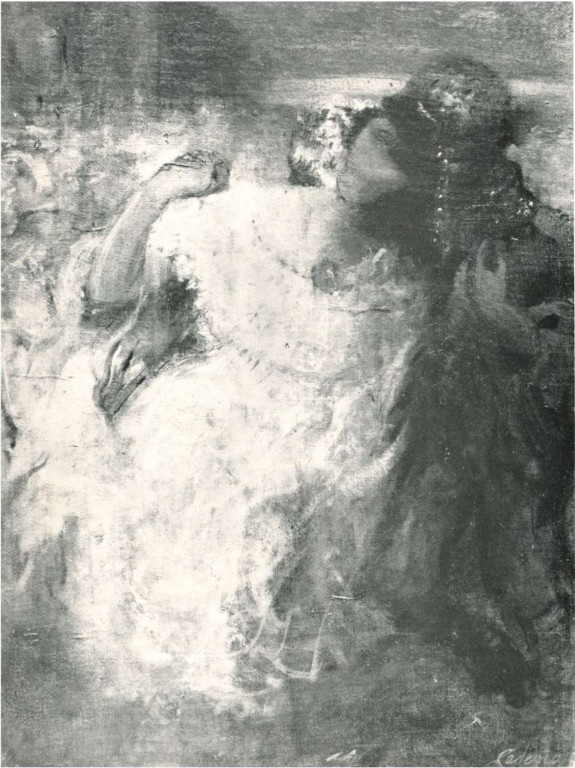
CENIZAS EN AZUERO, 1967