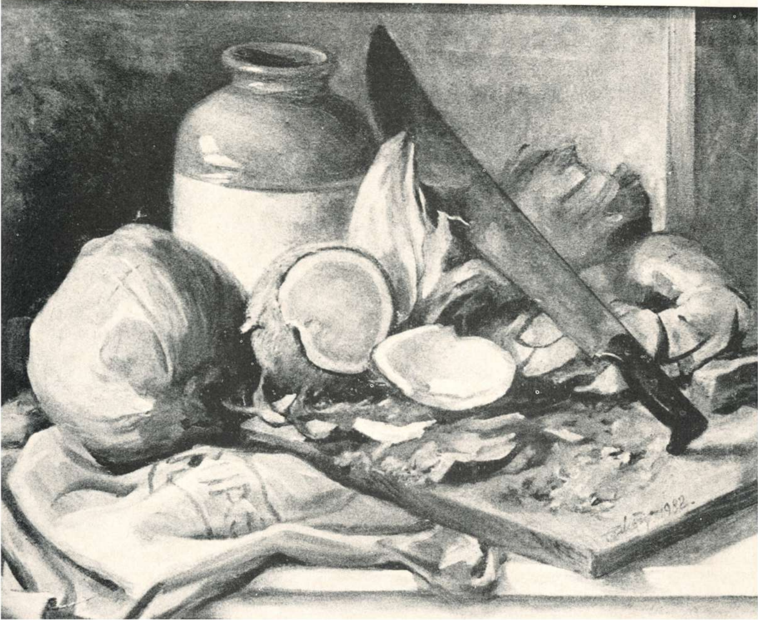
CARIBEÑO (NATURALEZA ESTÁTICA), 1982