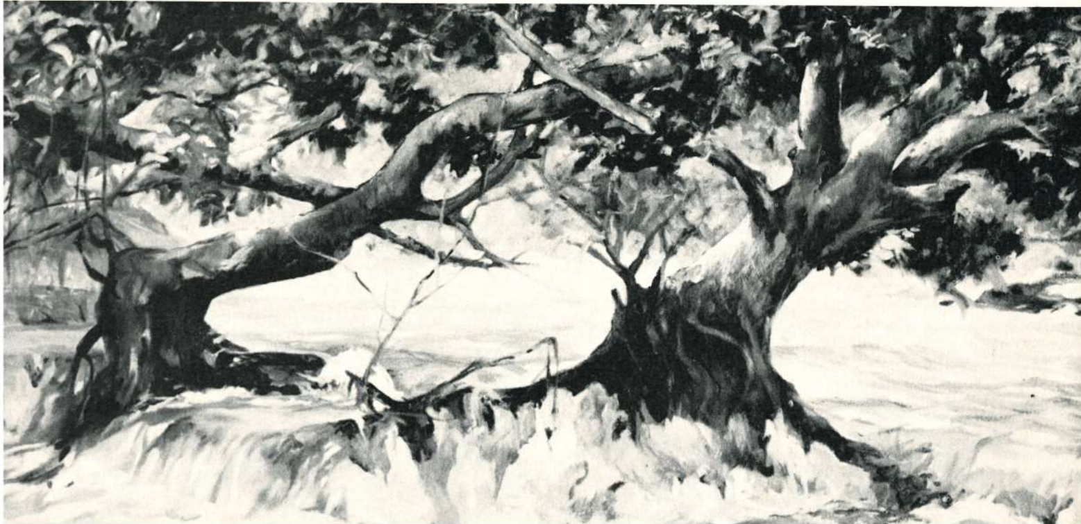
RIO CRECIDO, 1976