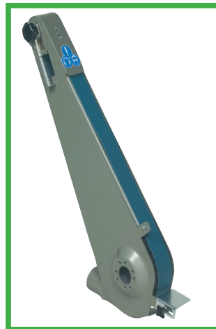
Right hand side Article No. 15 52 280

GB Delivery on pedestal with exhaust is possible.