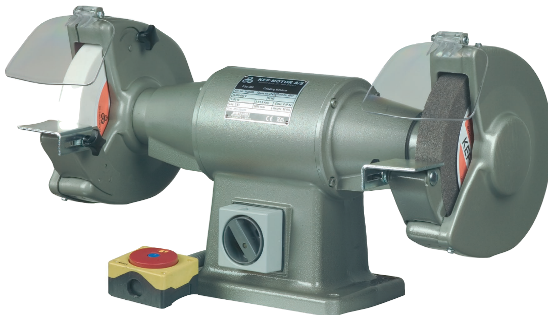
Article No. 15 324 21