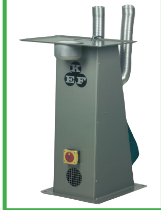
3x400 V Article No. 10 22 339

DK Leveres også på søjle med dobbelt udsugning