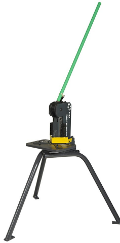
Base for ES corner notcher (accessory)