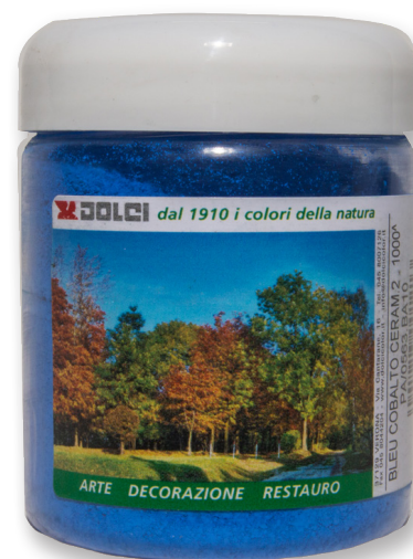
Bleu di Cobalto ceram 2 flacon de 100g

Les couleurs représentées en photo sont indicatives et n'ont pas de valeur contractuelle. La maison Dolci Colori srl se réserve le droit d'apporter des modifications à cette fiche sans préavis.