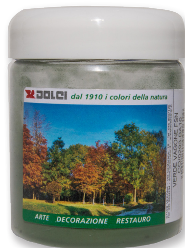
Verde Vagone FSN flacon de 100g

Les couleurs représentées en photo sont indicatives et n'ont pas de valeur contractuelle. La maison Dolci Colori srl se réserve le droit d'apporter des modifications à cette fiche sans préavis.