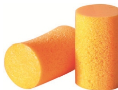
FirmFit™ sin cordón