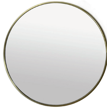
AVANT / FRONT