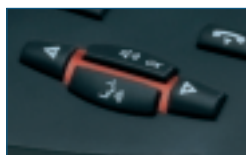
Touches de contrôle audio

Les fonctions de contrôle audio (commande du volume du haut-parleur, commande audio mains libres, secret, etc.) sont dissociées des touches de fonction du système afin de permettre à l'utilisateur de contrôler facilement et aisément la partie audio. Ces touches servent également en cours de communication pour régler le niveau sonore du combiné.