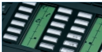
Étiquettes personnalisables. Grandes touches transparentes à effet de loupe

Les terminaux Alcatel Reflexes™ possèdent des touches programmables par l'utilisateur ou par l'administrateur du système. Des étiquettes peuvent être proposées par le constructeur (programmation standard) ou réalisées par l'utilisateur. Déterminer l'état d'une communication est très simple grâce aux icônes intelligibles qui remplacent l'utilisation complexe de clignotement de diode. La lecture des étiquettes associées à chacune des touches est facilitée par un effet loupe. Cette dernière caractéristique est protégée par un brevet Alcatel.