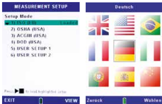
Wahl der Konfiguration