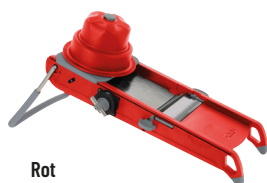
Rot 2015.43 Mit Schieber und Wagen + horizontale Doppelklinge 4-10 mm