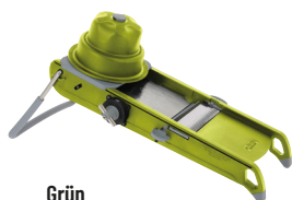
Grün 2015.23 Mit Schieber und Wagen + horizontale Doppelklinge 4-10 mm