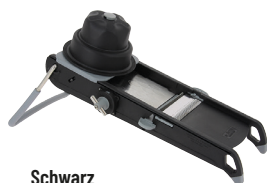
Schwarz 2015.03 Mit Schieber und Wagen + horizontale Doppelklinge 4-10 mm