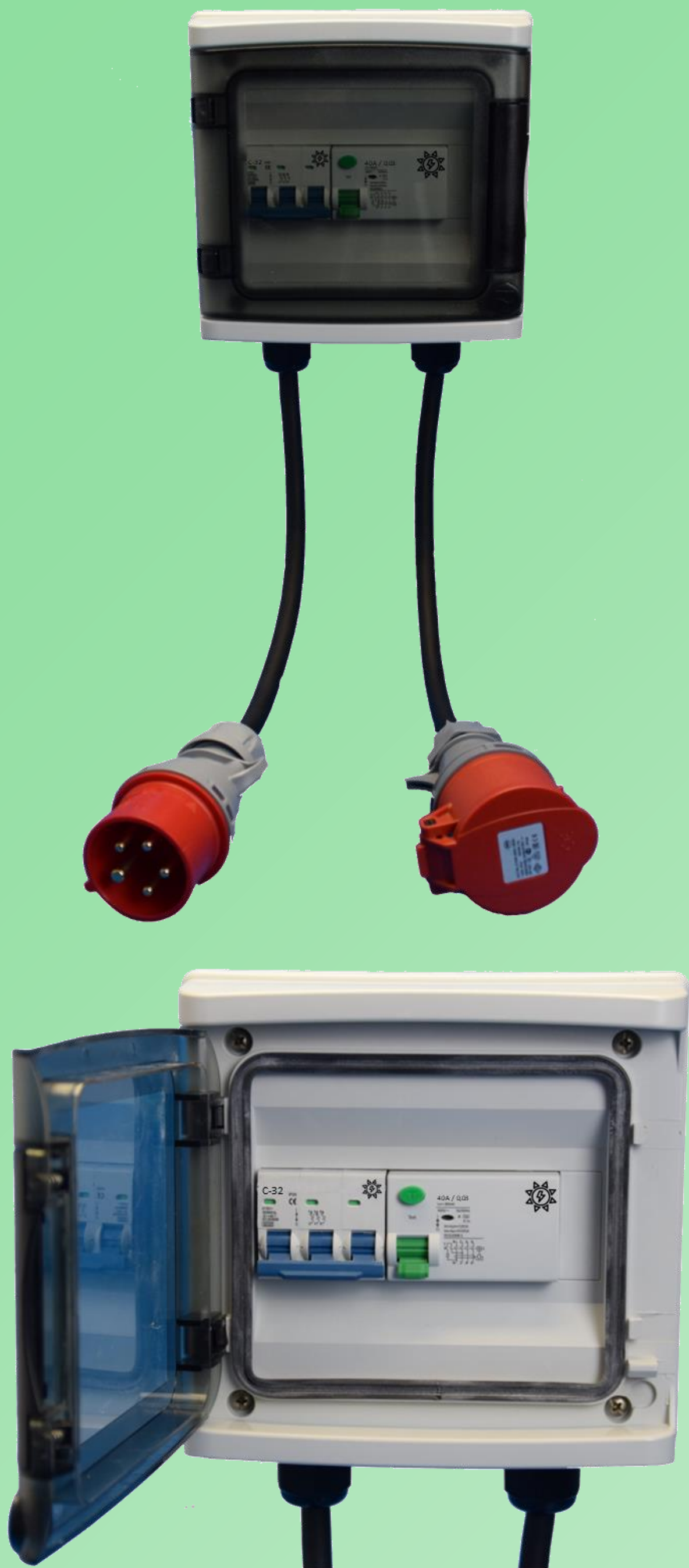
Stecker 32A CEE