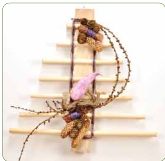
Træ med nisse Pynt grundtræet med lærkegrene og en sød nisse.