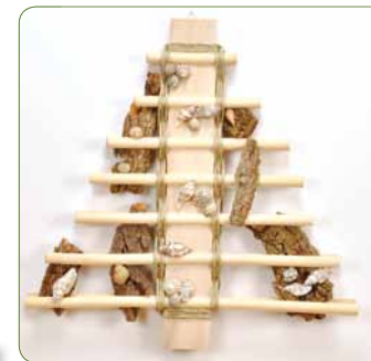
Træ med bark og skaller Væv med garn i naturfarver omkring stammen. Lim tørt bark ind imellem stavene og lim til sidst sneglehuse på.