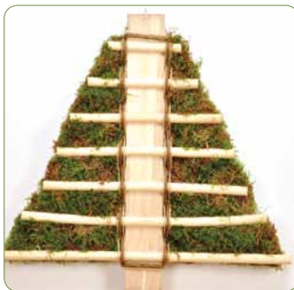
Mostræ Flet med grøn og brun papirgarn og fyld træet ud med mos.