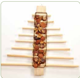
Kastanjetræ Træ med brun papirgarn og naturfarvet jutegarn. På stammen er limet kastanjer og kastanjeskaller med limpestol.