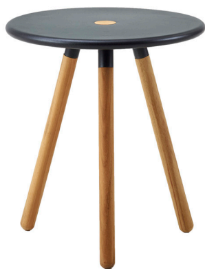
TAL Teak/Lava grey