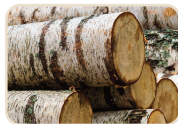
未切割前的白樺實木原材料