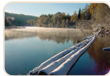
鄰近廠房的Gauja River, 流經木材資源豐富的拉脫維亞