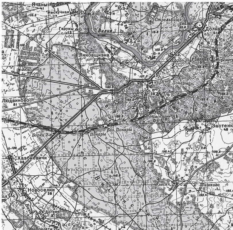
Paneriai ir jų apylinkės (1940). Pažymėta dab. Panerių memorialo vieta. Matoma būsiosios Jogailaičių (Jagiellonowo) gyvenvietės struktūra: kvartalų linijos.