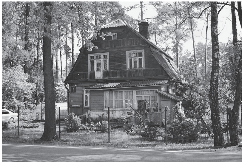
Iki šių dienų išlikę Jogailaičių (Jagiellonowo) gyvenvietės vasarnamiai. Zigmo Vitkaus nuotrauka

paslaugų zona bei keliais į Kauną ir Trakus, kadangi masinių žudynių istorija Paneriuose Lietuvos visuomenei (ir vilniečiams) tebėra sąlyginai mažai žinoma, o Žemuosius Panerius važiuodami į Vilnių ar iš Vilniaus yra kirtę daugelis Lietuvos gyventojų. XX a. šeštame ir septintame dešimtmečiuose Žemieji Paneriai tapo didžiausiu Vilniaus pramoniniu rajonu: čia pastatytos plytų, gelžbetoninių konstrukcijų, medienos apdirbimo ir kitos įmonės, pradėjo veikti Vilniaus termofikacinė elektrinė. Šios ir kitos įmonės fiziškai ir jausmiškai nutolino upę ir prie jos vešėjusias pievas nuo dabartinio Savanorių prospekto, sykiu į antrą planą nustūmė Panerių kaip masinių žudynių vietos vaizdinį.