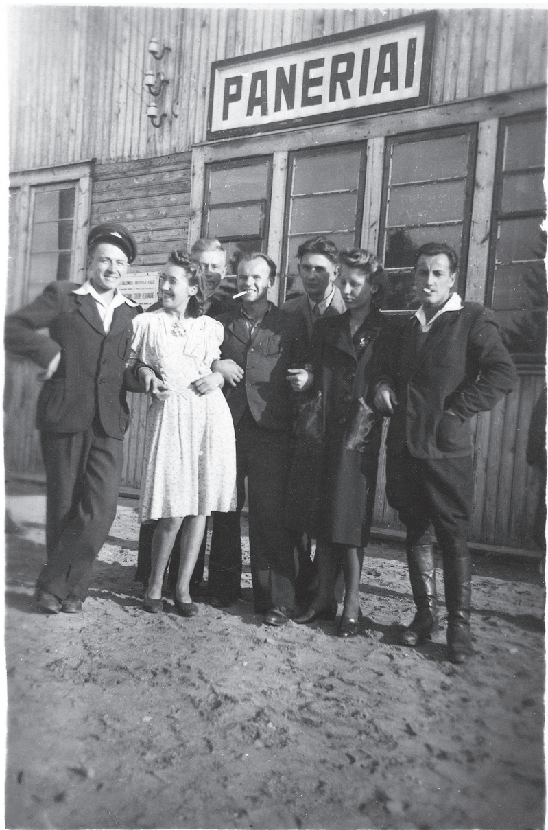
Prie Panerių geležinkelio stoties pastato. 1944–1945 (?) Senoji Panerių geležinkelio stotis buvo kitoje vietoje nei dabartinė – arčiau tunelio.